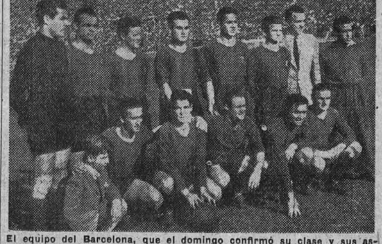
El equipo del Barcelona, que el domingo confirmó su clase y sus aspiraciones al título, al conseguir empatar en el Metropolitano con el Atlético madrileño.