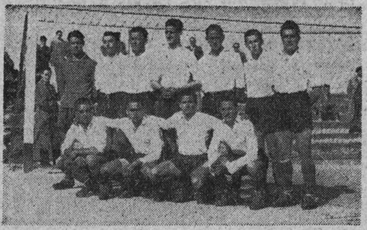
El Salamanca, que el domingo se adjudicó el título de campeón de Castilla de aficionados, al vencer al Guadalajara.

El domingo, en el campo de la Federación, el Salamanca venció por un gol a cero al Guadalajara en la final del Campeonato de Castilla de aficionados. Tanto el equipo victorioso como el derrotado dieron muestras, en el transcurso del encuentro, de tener un gran entusiasmo, pero poco juego y escasa técnica, por lo que este año nos tememos que nuestra región no llegue muy lejos en el Campeonato de España.