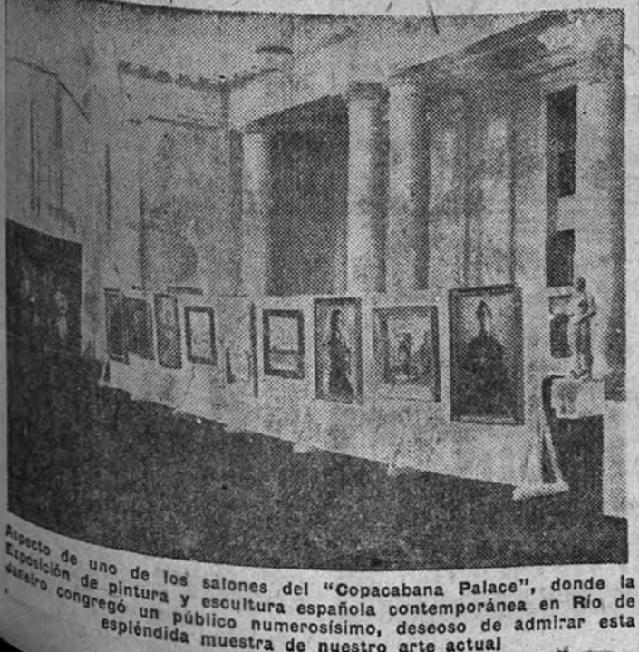
Aspecto de uno de los salones del "Copacabana Palace", donde la Exposición de pintura y escultura española contemporánea en Rio de Janeiro congregó un público numerosísimo, deseoso de admirar esta espléndida muestra de nuestro arte actual.