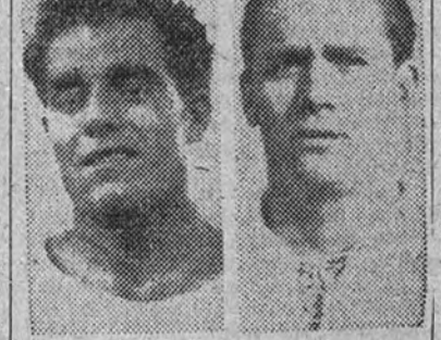
El equipo del Real Madrid, que el domingo jugó en Barcelona contra el Español y el Atlético.