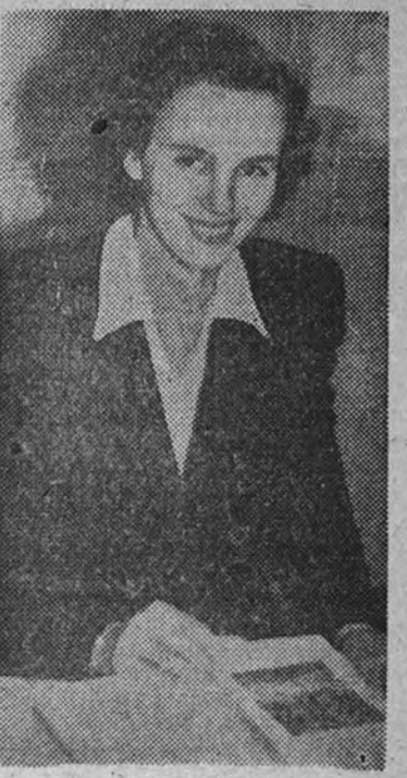
Ana de Borbón-Parma

Se funda en que el novio se opone a que sus hijos se eduquen en la religión católica