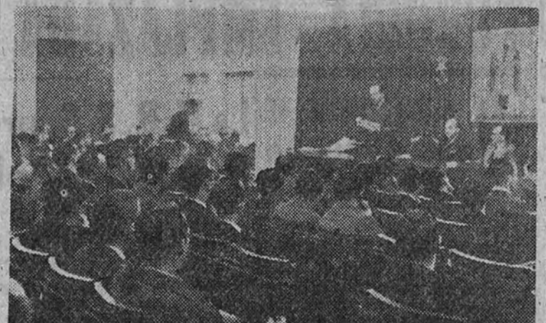
El Secretario Nacional de Sindicatos, camarada Mario López, presidiendo la reunión de los Vicesecretarios de Ordenación Social de todas las provincias españolas, celebrada en la Delegación Nacional de Sindicatos.

El Secretario Nacional de Sindicatos presidió la sesión inaugural