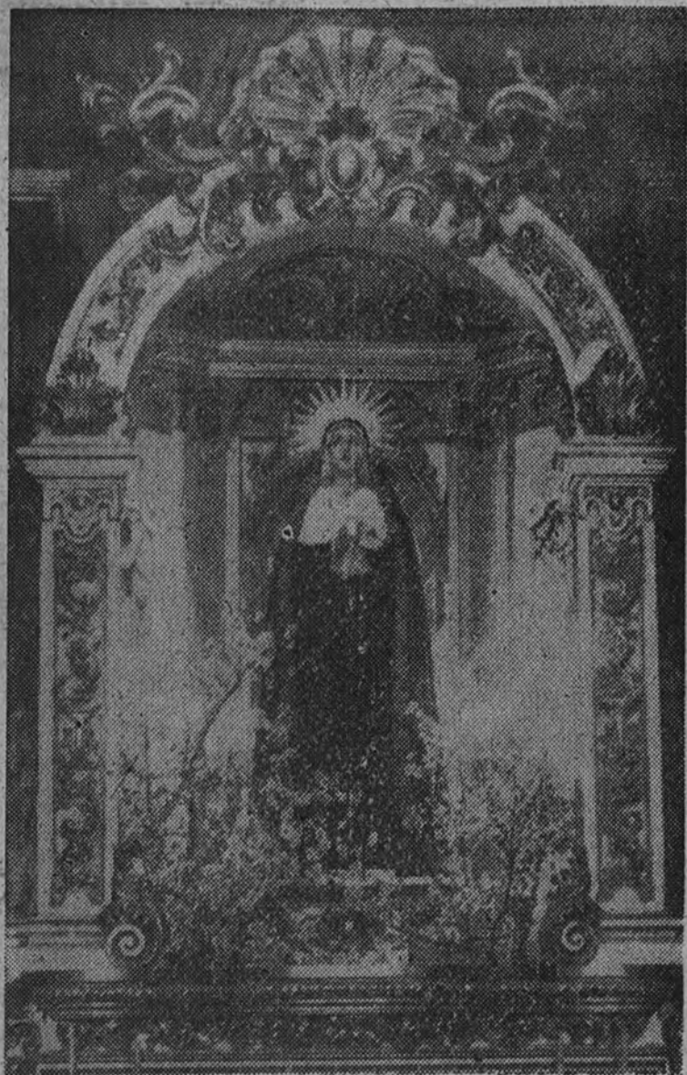
La "Virgen de la Soledad"

Existen nueve Hermandades que poseen espléndidas tallas de las imágenes de sus titulares