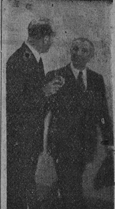
El Rey Humberto, al salir del comedor, se dirige a sus habitaciones.

—Su Majestad accede gustoso a posar un instante para el fotógrafo, pero usted no obtendrá ninguna.