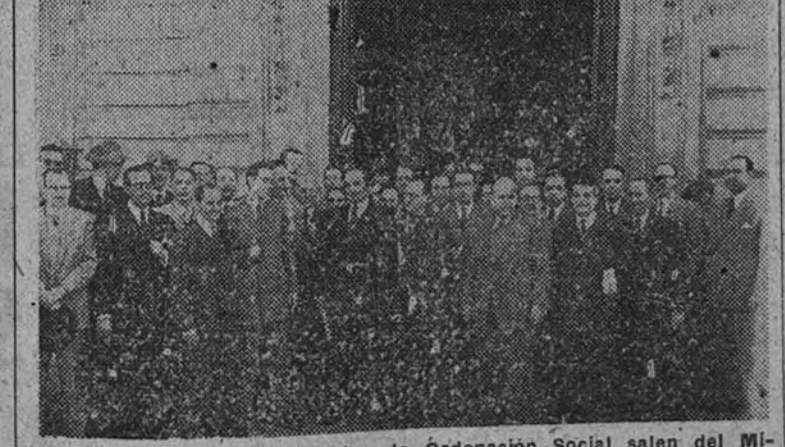
Los Vicesecretarios Provinciales de Ordenación Social salen del Ministerio de Trabajo después de visitar al Ministro

Ayer se clausuró la Asamblea de Vicesecretarios con un discurso de Sanz Orrio