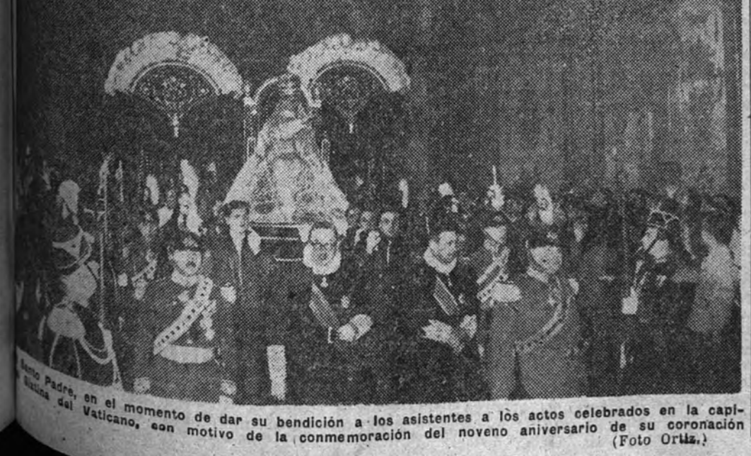
El Papa, en el momento de dar su bendición a los asistentes a los actos celebrados en la capilla del Vaticano, con motivo de la conmemoración del noveno aniversario de su coronación.

El Congreso también está al tanto de los sucesos referentes a las (Continúa en cuarta página.)