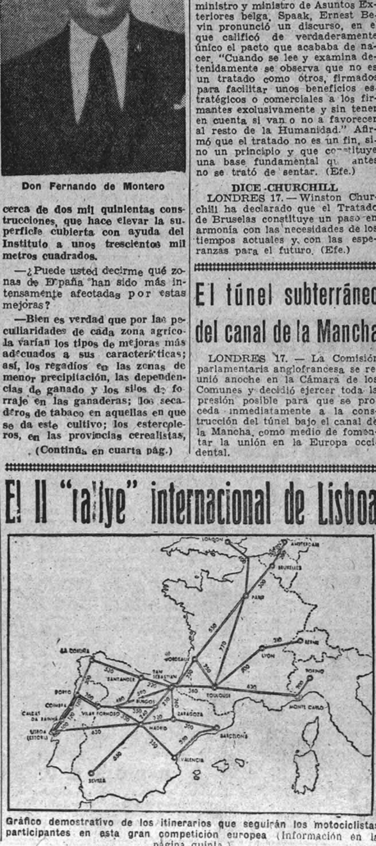
Gráfico demostrativo de los itinerarios que seguirán los motociclistas participantes en esta gran competición europea. (Información en la página quinta.)