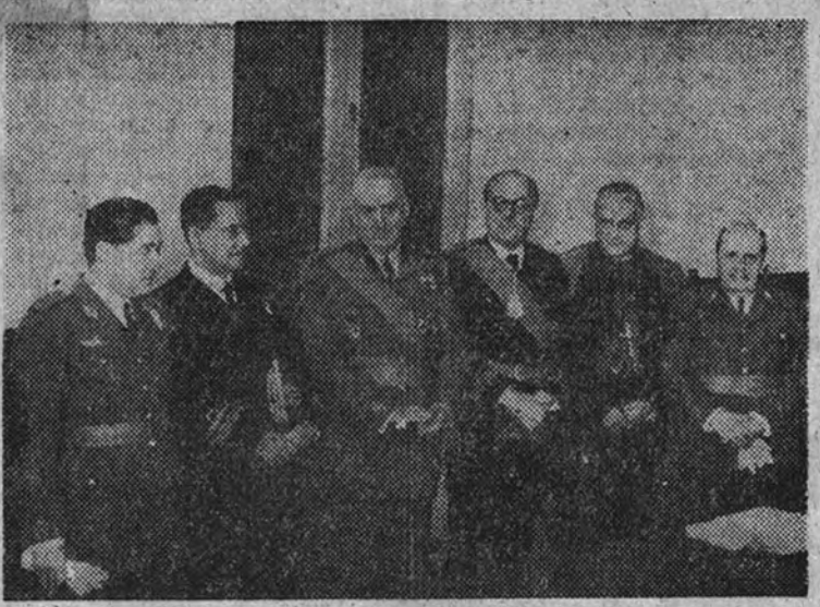
El señor Fernández Ladreda, Ministro de Obras Públicas, acompañado de los de Educación Nacional, Ejército, Marina y Aire y del obispo patriarca de la diócesis, durante el acto de su recepción en la Academia de Ciencias.