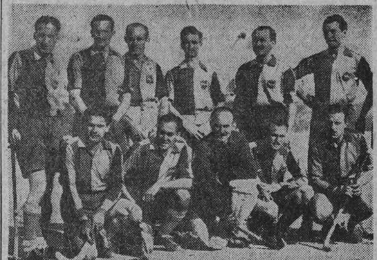
El equipo del Barcelona, actual campeón nacional, que no podrá defender su título por no haberse clasificado este año para el Campeonato de España.

Seis equipos disputarán los días 15, 16, 17 y 18 del actual, en Tarrasa, la fase final del Campeonato de España