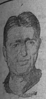
Albert C. Wedemeyer

"Se están formando negros nubarrones de guerra en el horizonte", ha dicho el teniente general Wedemeyer, miembro del Estado Mayor del Ejército norteamericano, en un acto celebrado con motivo del Día del Ejército en Los Angeles. Luego recomendó que los Estados Unidos se armen para evitar cualquier agresión, puesto que las medidas de reducción militar adoptadas por los congresos internacionales no han sido sabias.