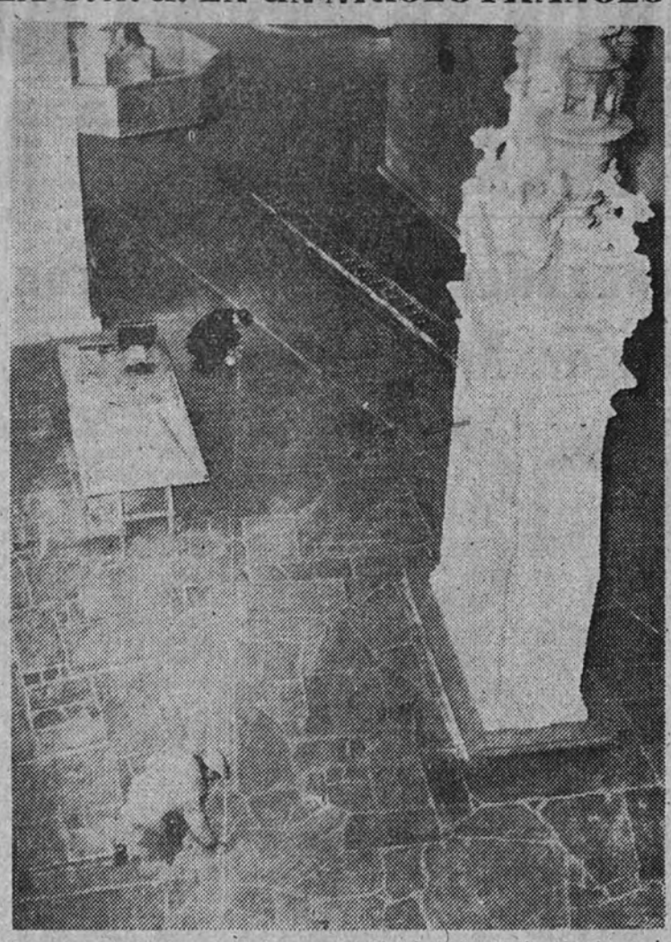
Obreros trabajando en el Museo del Hombre de París, donde serán instaladas diversas oficinas administrativas de la Asamblea General de la O. N. U. que, como se sabe, ha de reunirse en la capital francesa