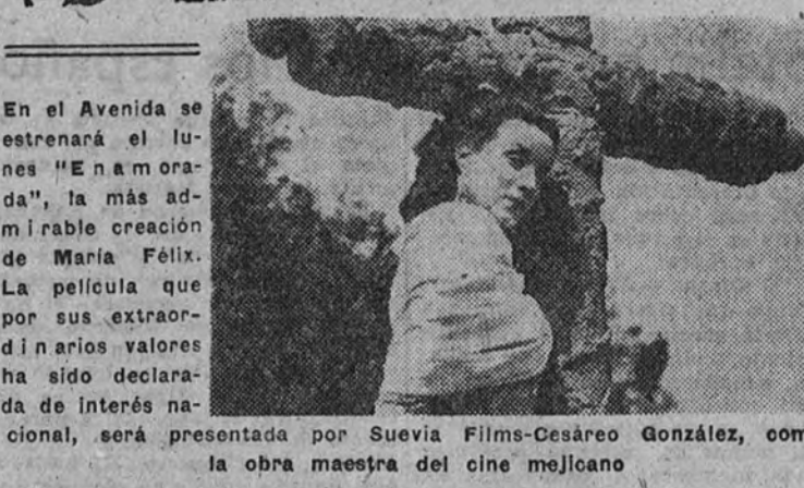
En el Avenida se estrenará el lunes "Enamorada", la más admirable creación de María Félix. La película que por sus extraordinarios valores ha sido declarada de interés nacional, será presentada por Suevia-Films-Cesáreo González, como la obra maestra del cine mejicano