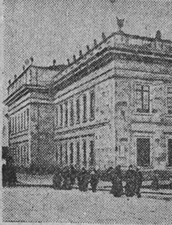
Palacio del Capitolio de Bogotá

WASHINGTON 9. —Un consejero del departamento de Estado