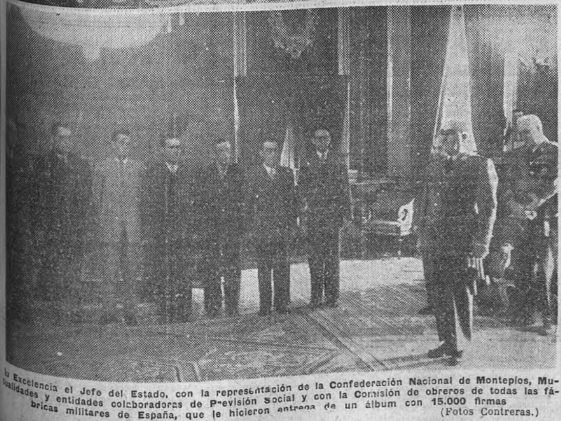
El Excelentísimo el Jefe del Estado, con la representación de la Confederación Nacional de Montepios, Mutualidades y entidades colaboradoras de Previsión social y con la Comisión de obreros de todas las fábricas militares de España, que le hicieron entrega de un álbum con 15.000 firmas