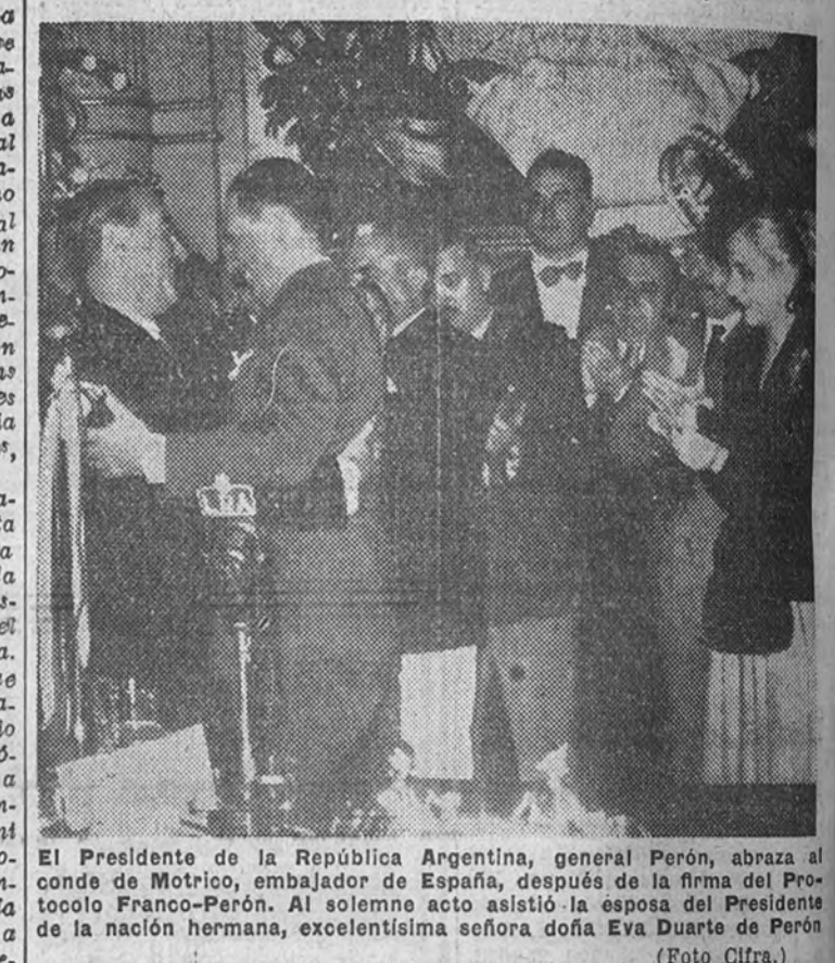
El Presidente de la República Argentina, general Perón, abraza al conde de Motrico, embajador de España, después de la firma del Protocolo Franco-Perón. Al solemne acto asistió la esposa del Presidente de la nación hermana, excelentísima señora doña Eva Duarte de Perón.