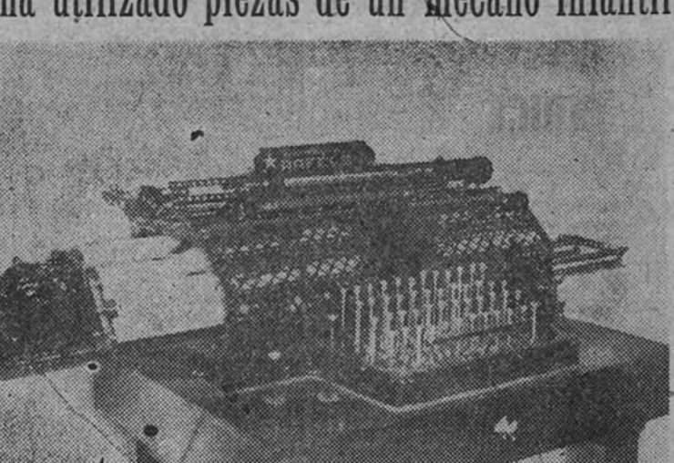
Aspecto del "Traductógrafo Rafels", construido por su inventor con las piezas de un "mecano"

Tiene la forma de una máquina de escribir. En un chasis hecho con piezas de mecano se