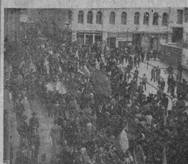
Aspecto que ofrecía una de las calles de Bogotá durante los últimos sucesos revolucionarios. Grupos muy numerosos de agitadores llevando banderita y toda clase de armas, fueron por algunas horas dueños de la situación, que al fin dominó el Gobierno

Un señor de Lisboa detenido por coleccionar atropellados