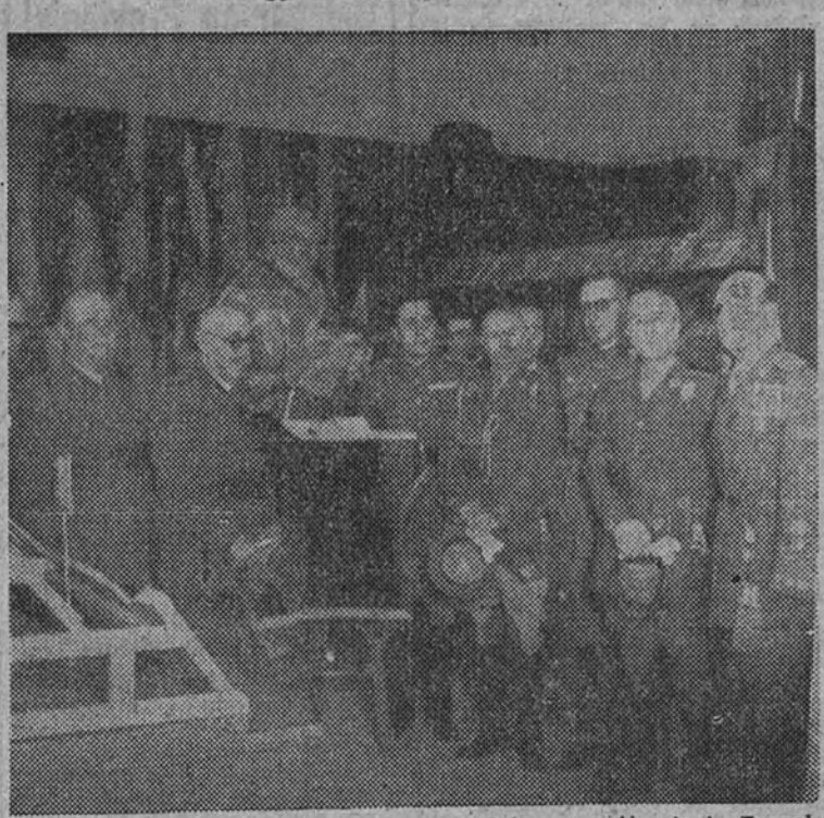
Los generales y jefes que asistieron a la inauguración de la Exposición bibliográfica de escritores militares

Fué inaugurada como homenaje a Cervantes