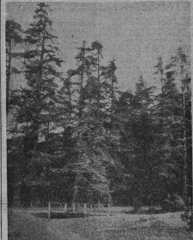
Los cedros de Ketama

(CRONICA DE NUESTRO REDACTOR CORRESPONSAL ANTONIO J. ONIEVA)