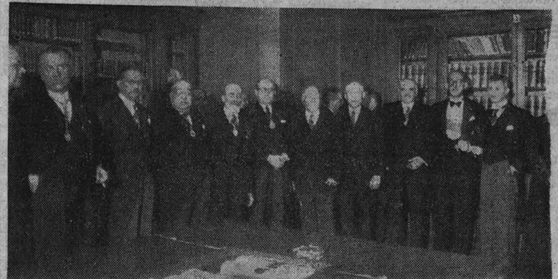
Los miembros de la Asamblea Cervantina de la Lengua, reunidos en la Real Academia Española momentos antes de dar comienzo la sesión de clausura, bajo la presidencia del Ministro de Educación Nacional

El Ministro de Educación y representaciones nacionales y extranjeras participaron en el homenaje al inmortal autor