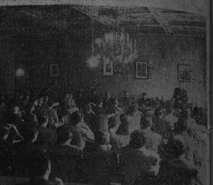
Aspecto del salón de actos de la Escuela del Magisterio, durante la clausura del cursillo de Instructores Elementales del Frente de Juventudes.

Presidió el Secretario Nacional y desarrolló la última lección el Asesor de Formación Política