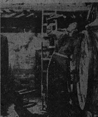
Edici reestrenará mañana en los salones Luchana y Progreso "Vivir en paz", el gran film italiano premiado en diversos certámenes cinematográficos

Esto es "Principio o fin". De ahí que nadie pueda dejar de ver esta grandiosa producción de Hollywood, que nadie podrá tampoco olvidar jamás. Y esta gran obra de la cinematografía mundial será distribuida en España por Suevia Films (Cesáreo González), la firma que no repara en medios para dar a conocer a los españoles las mejores películas nacionales y las extranjeras más sorprendentes, como ésta, para cuya realización, dirigidos por Norman Taurog, han sido reunidos los mejores intérpretes y los más costosos elementos de producción.