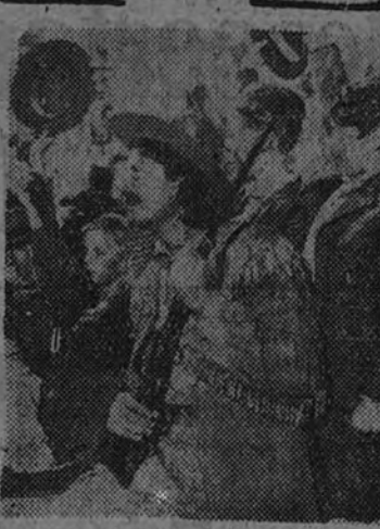
El gran cazador y guerrero Buffalo Bill fue el ídolo de los niños norteamericanos. Escena de "Aventuras de Buffalo Bill", de Fox, que en el Rex alcanza su sexta semana de éxito

BETTE DAVIS EN UNA VIDA ROBADA ES LA BETTE DAVIS MAS GENIAL 2.ª semana EXITO REAL CINEMA