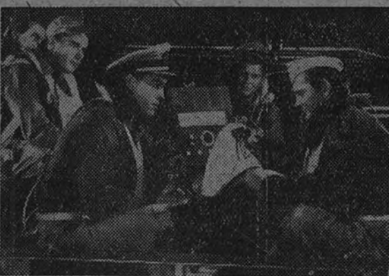
"Principio o fin", de interesantísima trama en torno a los experimentos atómicos, se presenta mañana en el lujoso Avenida por Suevia Films-Cesáreo González

DESDE MAÑANA, "EL OTRO AMOR", EN EL PALACIO DE LA PRENSA. La más alta creación artística de la eximia actriz Barbara Stanwyck es "El otro amor", que mañana lunes ofrece la renombrada marca Cepica en el suntuoso cine Palacio de la Prensa. Su apasionante y original argumento, basado en una novela inédita de Remarque, cautiva desde su iniciación hasta el final, sin que decaiga un momento su interés. Todas las mujeres saben lo que es el amor. Pero pocas mujeres saben lo que es "El otro amor". Nada tiene de extraño la expectación que ha despertado el nuevo estreno del Palacio de la Prensa, cuya selecta pantalla, una vez más, se acredita por sus sorprendentes programaciones. El director André de Toth ha reunido en esta obra, muestra del cine moderno a un escogido y selecto elenco artístico que encabeza la sin par Barbara Stanwyck, con David Niven, María Palmer, Joan Loring y Richard Conte. "El otro amor" ha de llevar al Palacio de la Prensa a lo más selecto de nuestros aficionados, y ha de constituir otro triunfo que añadir a los muchos ya obtenidos por tan destacada pantalla y la renombrada marca Cepica.