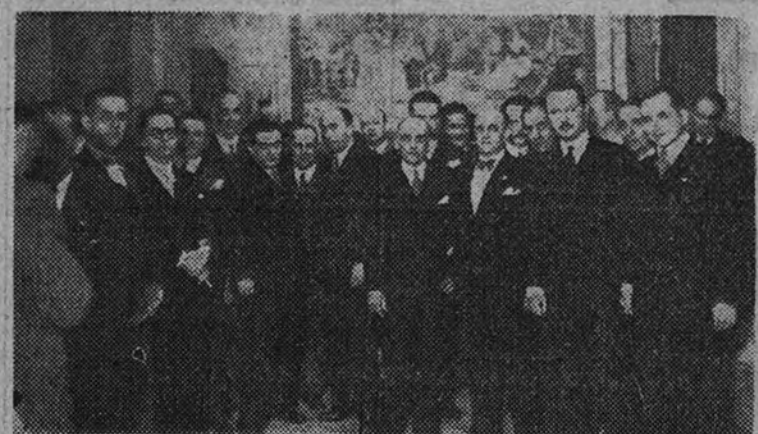
El encargado de Negocios de Cuba, señor Corpión, con algunas de las personalidades que asistieron a la recepción que ofreció en honor de los periodistas de su país

También visitaron el Museo del Prado y El Escorial