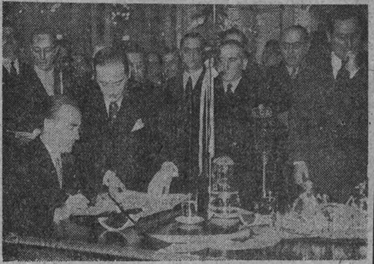
El acto de la firma del Protocolo

tiene por causa la cotización de 1.880 francos por 100 pesetas dado como base futura de los acuerdos francoespañoles. Se ha intentado calmar a la opinión pública ofreciendo que esta cotización revestirá simplemente un carácter oficial, puramente teórico, y que, en conjunto, Tángor no tiene razón alguna para seguir dicho tipo de cotización.