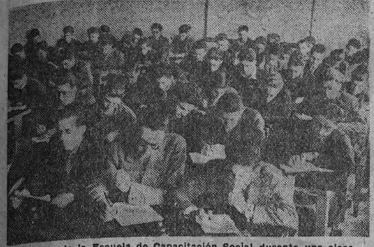
Alumnos de la Escuela de Capacitaci n Social durante una clase

Est  integrada por un centenar de aprendices, encuadrados en el Frente de Juventudes