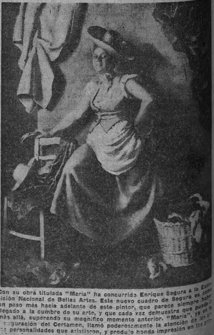
Con su obra titulada "Marian" ha concurrido Enrique Segura a la Exposición Nacional de Bellas Artes. Este nuevo cuadro de Segura es un paso más hacia adelante de este pintor, que parece siempre haber llegado a la cumbre de su arte, y que cada vez demuestra que puede ir más allá, superando su magnífico momento anterior. "Marian" es la figura del Centauro, llamó poderosamente la atención de los críticos y personalidades que asistieron, y produjo honda impresión en los profesionales y en los críticos.