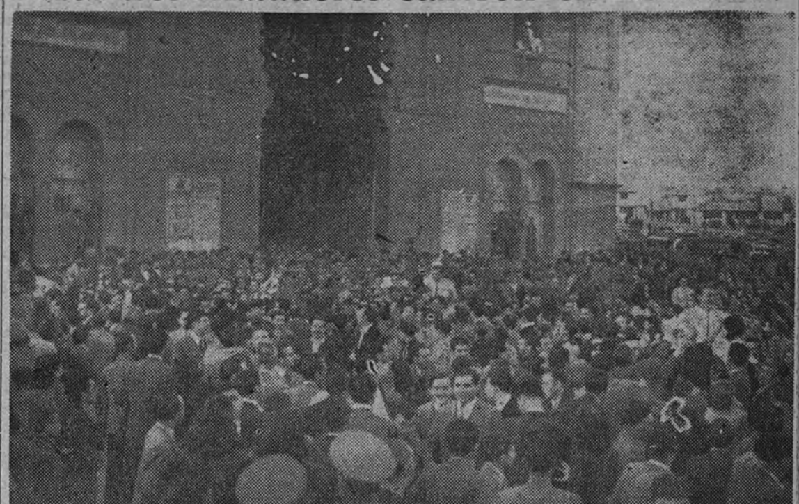
Los tres matadores salen de la Plaza a hombros