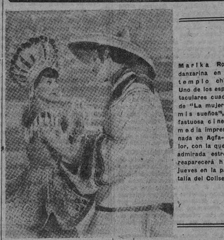
Marika Rokk, danzarina en un templo chino. Uno de los espectaculares cuadros de "La mujer de mis sueños", la fastuosa cinecomedia impresionada en Agfacolor, con la que la admirada estrella reaparecerá hoy y jueves en la pantalla del Coliseum.