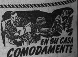
EN SU CASA COMODAMENTE