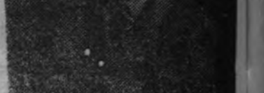
Anuncio de la película "La hija del capitán" de Amadeo Nazzari e Irasema Dillan.