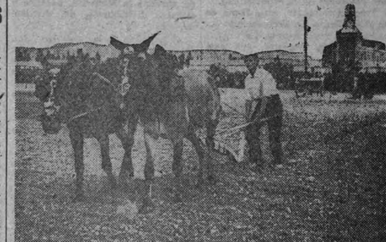
Uno de los participantes en el XI Concurso de Arada celebrado en Valladolid, con motivo de las fiestas de San Isidro Labrador