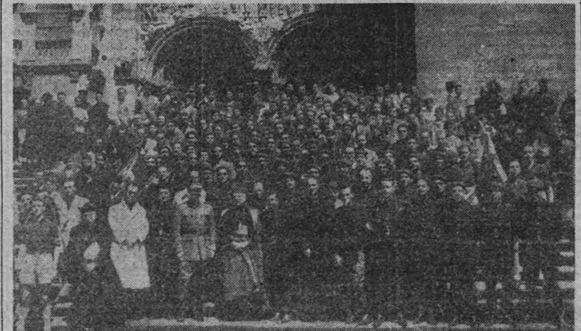
Miembros de la Escuela de Mandos "José Antonio" que han asistido a la peregrinación a Santiago, posando en la puerta de la catedral