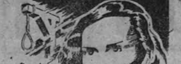
Anuncio de la película "La hija del capitán" de Amadeo Nazzari e Irasema Dillan.