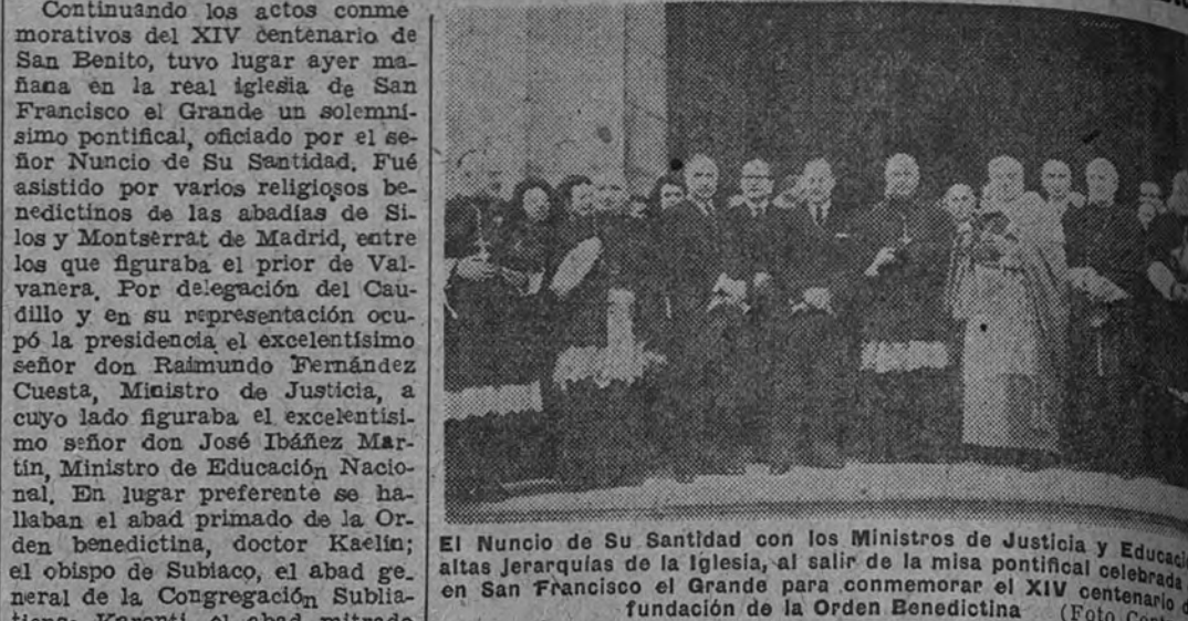
El Nuncio de Su Santidad con los Ministros de Justicia y Educación y altos jerarcas de la Iglesia, al salir de la misa pontifical celebrada en San Francisco el Grande para conmemorar el XIV centenario de la fundación de la Orden Beneditina.

Presidió el Ministro de Justicia, representando al Jefe del Estado