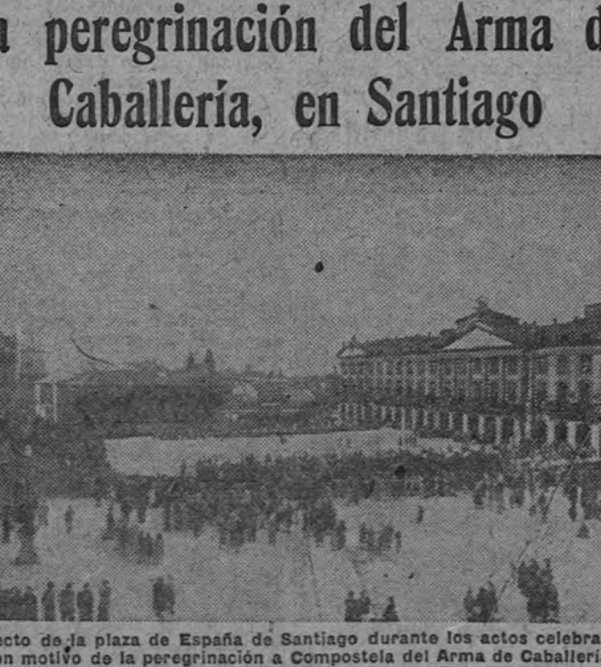
Aspecto de la plaza de España de Santiago durante los actos celebrados con motivo de la peregrinación a Compostela del Arma de Caballería.