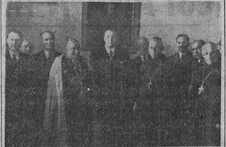
El Ministro de Asuntos Exteriores y el Nuncio de Su Santidad, con otras personalidades, clausura la Exposición y Asamblea de la Orden Beneditina

Solemne clausura de los actos del centenario de San Benito