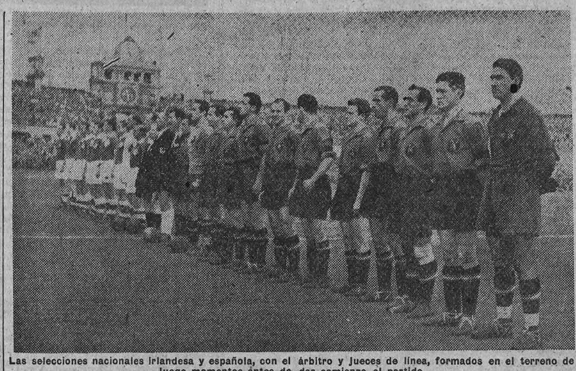
Las selecciones nacionales irlandesa y española, con el árbitro y jueces de línea, formados en el terreno de juego momentos antes de dar comienzo el partido.