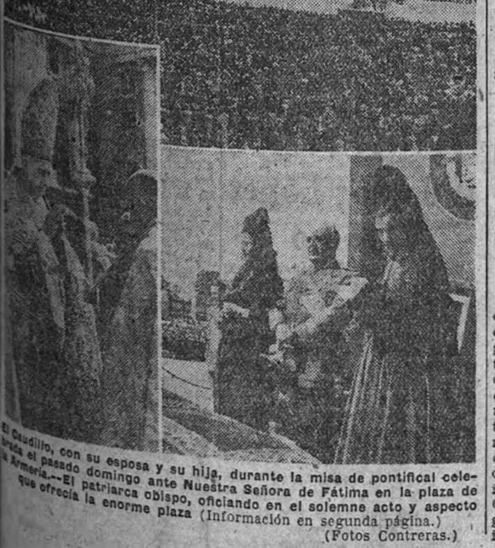
El pueblo, con su esposa y su hijo, durante la misa de pontifical celebrada el pasado domingo ante Nuestra Señora de Fátima en la plaza de la Armería.—El patriarca obispo, oficiando en el solemne acto y aspecto que ofrecía la enorme plaza. (Información en segunda página.)

EN LA PLAZA DE LA ARMERIA, ANTE LA VIRGEN DE FÁTIMA