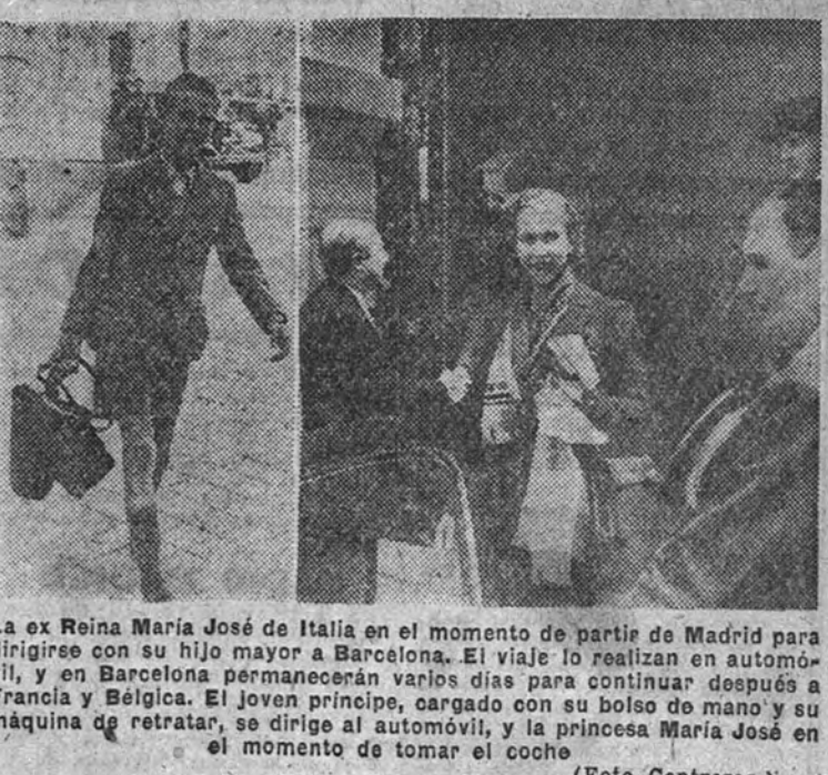
La ex Reina María José de Italia en el momento de partir de Madrid para dirigirse con su hijo mayor a Barcelona. El viaje lo realizan en automóvil, y en Barcelona permanecerán varios días para continuar después a Francia y Bélgica. El joven príncipe, cargado con su bolso de mano y su máquina de retratar, se dirige al automóvil, y la princesa María José en el momento de tomar el coche.