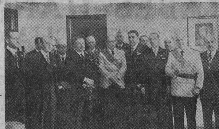
El Ministro de Educación Nacional con el embajador de Portugal y los miembros del I Congreso Hispanoportugués de Farmacia, que se está celebrando en la Universidad Central.

El Ayuntamiento ofreció a los congresistas un concierto-recepción