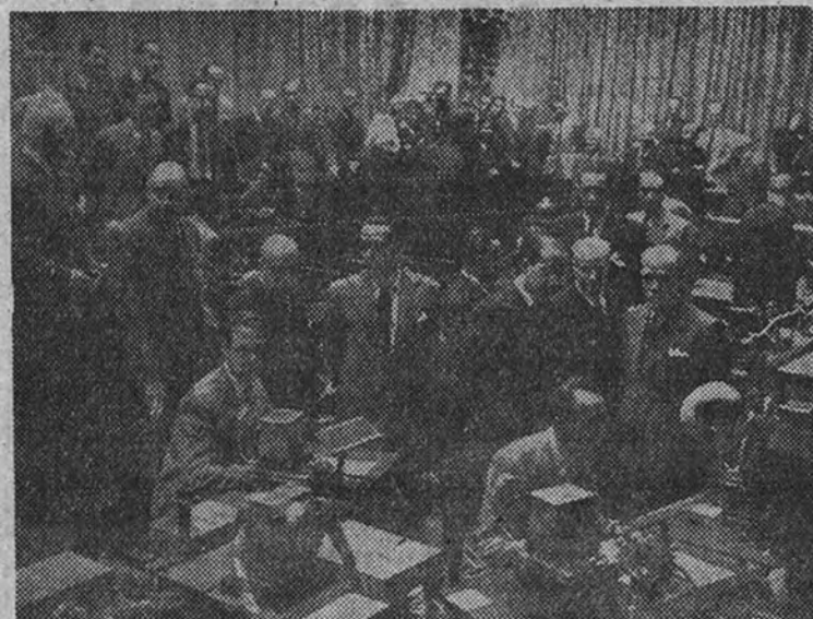
Aspecto del salón de actos del Palacio de Comunicaciones, convertido en sala de pruebas para las eliminatorias de Telecomunicación que han sido inauguradas con vistas al próximo Congreso Sindical.

El director general puso en marcha las instalaciones