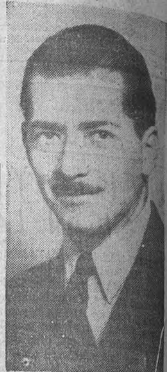
—En el siglo XX España aplica en Marruecos los mismos principios de tiempos de Carlos V y de Felipe II en América. Esta concepción tiende a ser humana. En la Universidad de Granada encuentran estudiantes marroquíes de Medicina, Filosofía y Letras; la artesanía marroquí ha cobrado nuevo impulso, metida al impulso de la Nación protectora. El Marrueco, español al alcanzar el alto nivel que España desea. De esto se enorgullece la arquitectura, como advierte al hablar con el jefe de Alcazarquivir, persona muy entendida en política internacional. El, que reiteradamente decía "nosotros los españoles", explicaba de esta manera la postura marroquí durante la guerra civil: "Comprendimos que la lucha era de los que creían en El. Nuestro sitio, por tanto, estaba al lado de los segundos."

—He conocido dos nuevas barriadas, que, en una población de la zona minera, se está levantando para aquellos obreros. Está una al norte del antiguo pueblo, y otra al sur. Y cuesta creer que aquellas casas estén destinadas precisamente para obreros. Eso te dará una idea de la impresión que yo recibí.