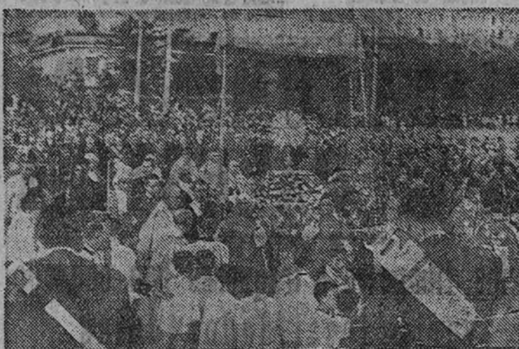
La procesión del Corpus a su llegada al paseo de Rosales.

En Rosales dió la bendición eucarística el obispo de Tocantins (Brasil)