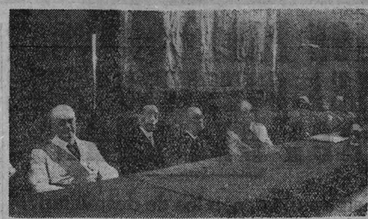
El Ministro de Educación Nacional presidiendo la sesión de clausura del Congreso Hispanoportugués de Farmacia

En nombre del Caudillo presidió el Ministro de Educación