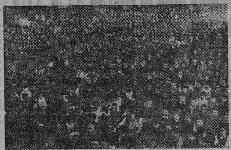
Aspecto que ofrecía el interior del templo de San Francisco el Grande durante la misa de pontifical celebrada por los Hermanos de la Doctrina Cristiana.

El Ministro de Educación presidió una comida en el colegio de Maravillas