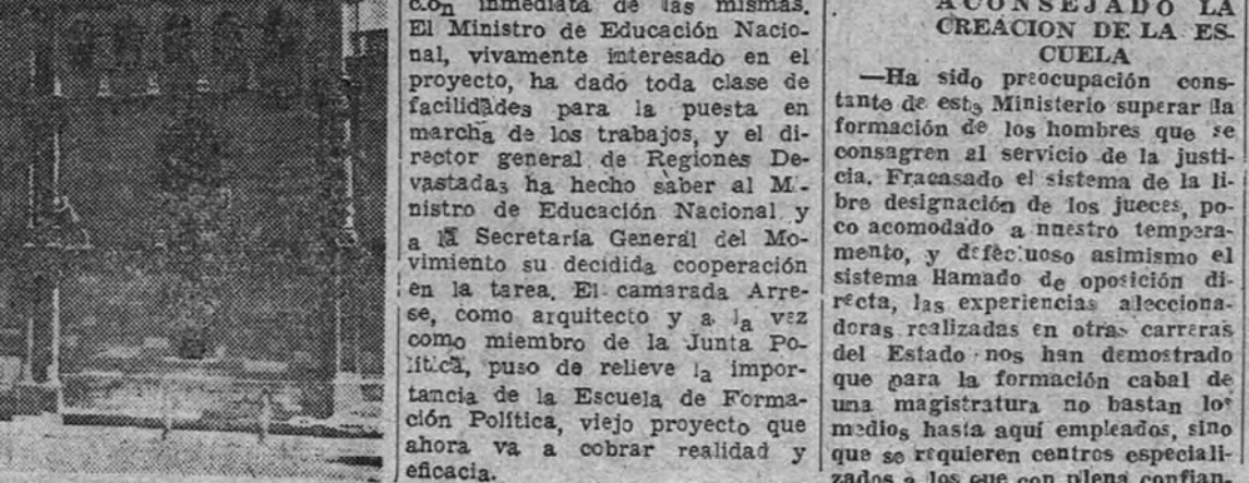
Avuntamiento de Madrid

VANDENBERG ACUSA A LA CAMARA WASHINGTON 10.—El presidente del Senado, Arthur H. Vandenberg, acusó a la Cámara de los Representantes de poner en peligro "nuestra paz y la libertad del mundo", al reducir los fondos para el programa de rehabilitación económica europea. (Efe.)