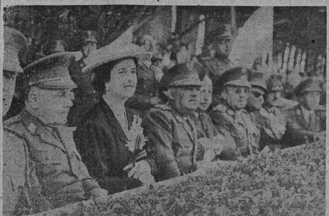
Su Excelencia el Generalísimo, acompañado de su esposa, el embajador de Portugal y varias jerarquías militares, presenciando el desarrollo de la prueba, en la que se disputó la Copa por el donado, correspondiente al Concurso Hípico Internacional que se celebró en la pista de la Casa de Campo.

(Amplia información en la página de deportes.)