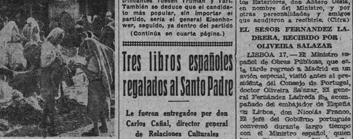
Un aspecto del zoco de Tetuán

unos u otros. Seguramente en su fuero interno propugnan sus preferencias: perfectamente legítimo lo que cada uno quiere oponer. En cuanto a manifestaciones exteriores, ni se producen ni nadie tiene interés en producir. En números redondos hay en Tetuán 40.000 musulmanes y 9.500 israelitas, y aparte algunos extranjeros de una y otra raza, que tienen su domicilio en el llamado barrio europeo, la mayor parte