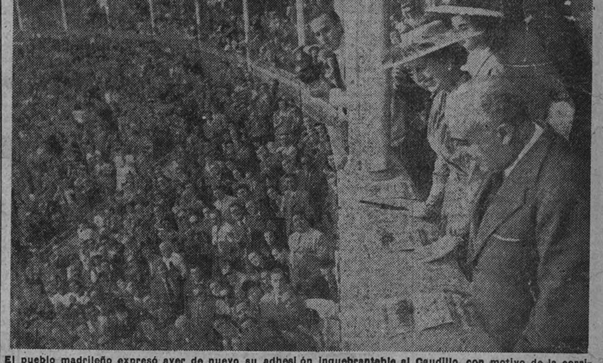
El pueblo madrileño expresó ayer de nuevo su adhesión inquebrantable al Caudillo, con motivo de la corrida de la Beneficencia. Al aparecer el Generalísimo en el palco presidencial, acompañado de su esposa e hijos, el público, puesto en pie, le acogió entre clamorosos vítores y aplausos.