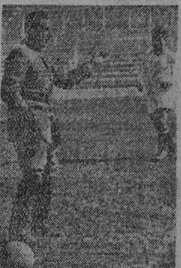
El seleccionador nacional, Guillermo Elizaguirre, dirige uno de los entrenamientos del equipo español