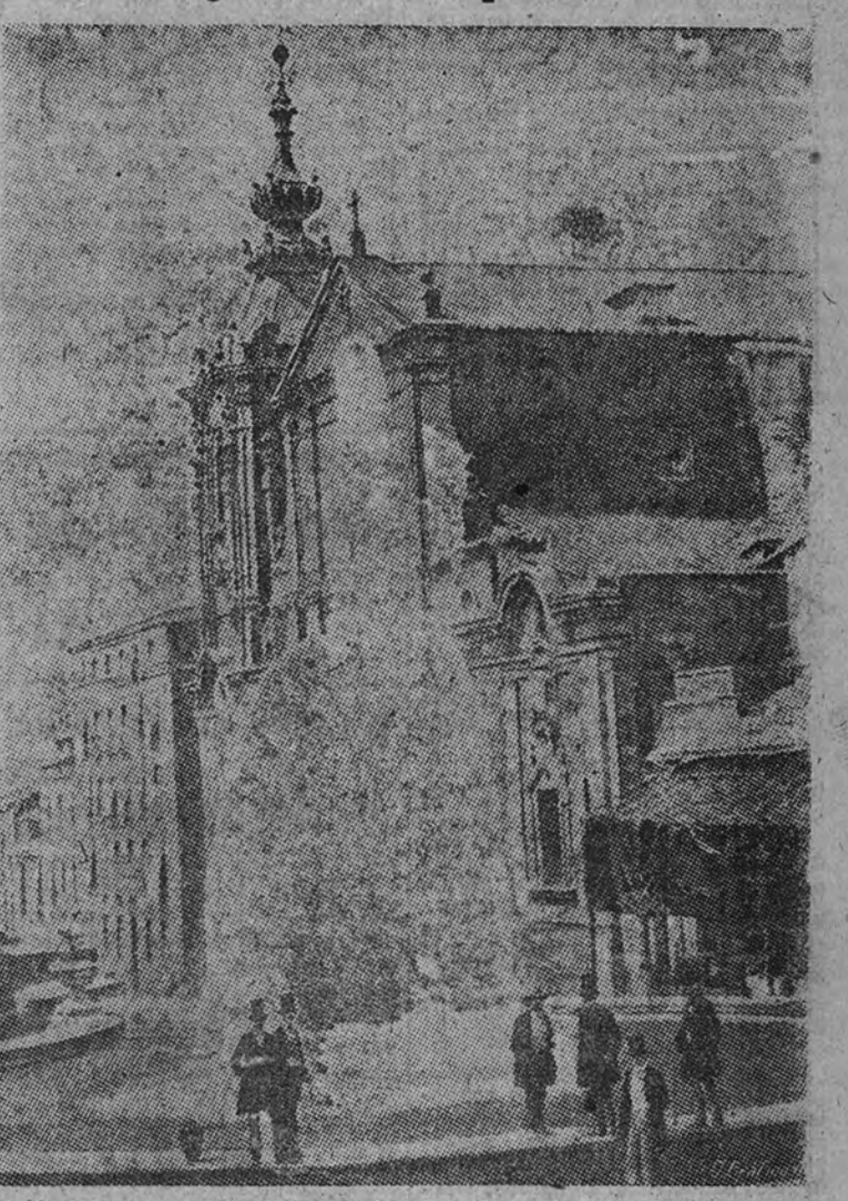
24 de junio de 1858.—Inauguración del abastecimiento. Fuente monumental en lo alto de la calle Ancha de San Bernardo