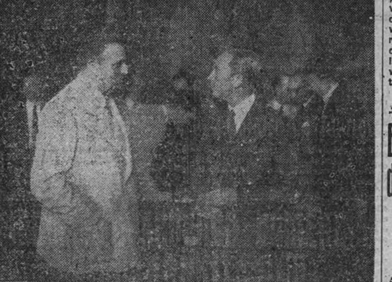
El Ministro de Asuntos Exteriores, en conversación con el ministro de Negocios británico, terminado el acto de la firma del tratado comercial (Foto Contreras).

Ayer mañana tuvo lugar en el palacio de Santa Cruz la firma solemne del acuerdo comercial y de pagos entre España e Inglaterra. Con el protocolo de costumbre, el Ministro de Asuntos Exteriores de España y el encar-