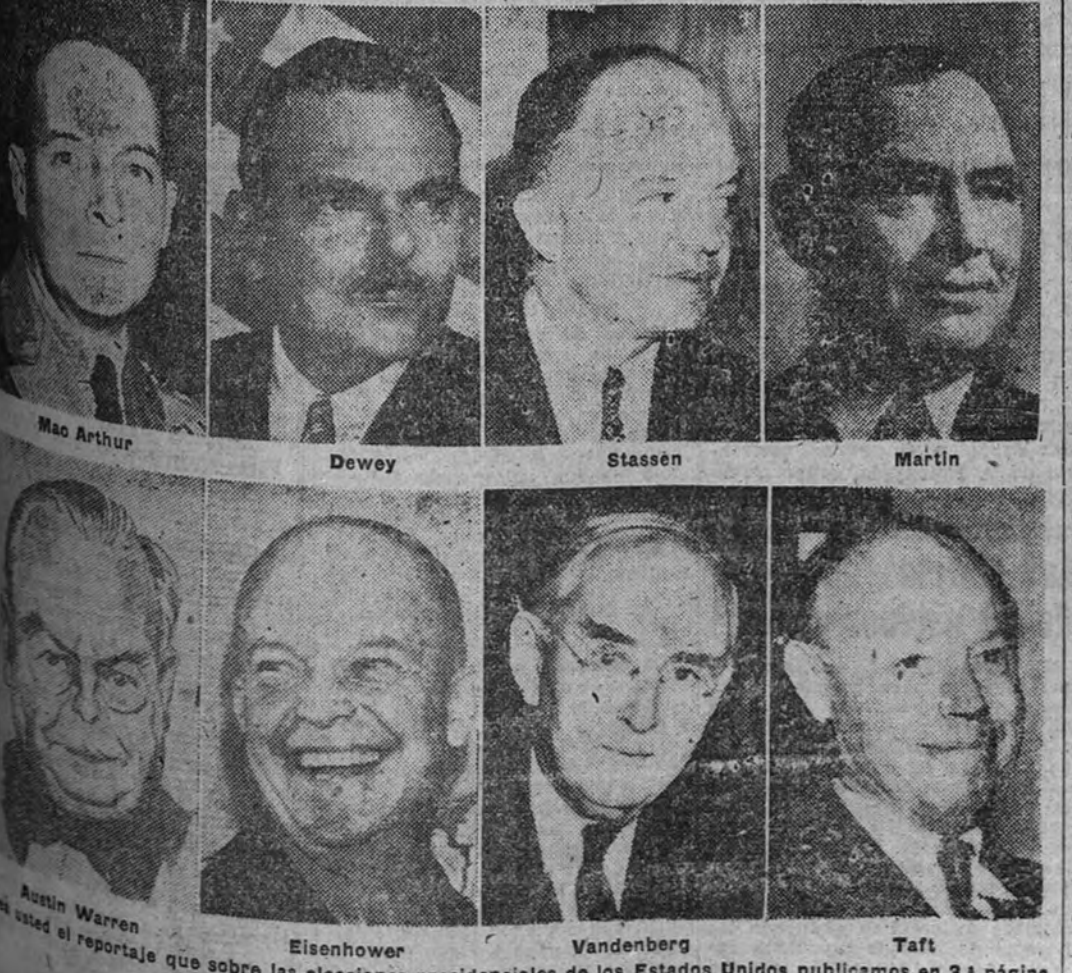
Mac Arthur, Dewey, Stassen, Martin, Eisenhower, Vandenberg, Taft