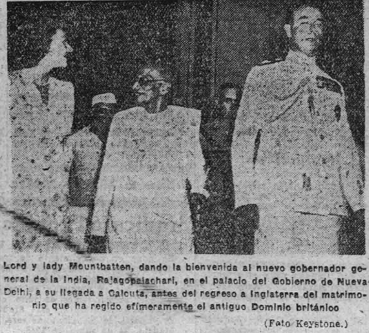
Lord y Lady Mountbatten, dando la bienvenida al nuevo gobernador general de la India, Rajagopalachari, en el palacio del Gobierno de Nueva Delhi, a su llegada a Calcuta, antes del regreso a Inglaterra del matrimonio que ha regido efímeramente el antiguo Dominio británico.