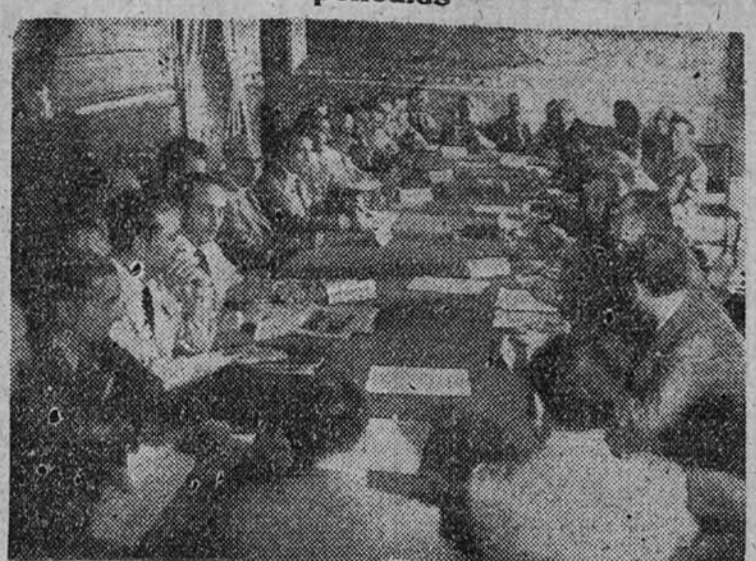
Las representaciones de la industria cinematográfica de la Argentina, México y España, durante las sesiones preparatorias del Congreso Cinematográfico Hispanoamericano, reunidos en el Palacio del Consejo Nacional

Ayer se vieron en Capitol las primeras películas