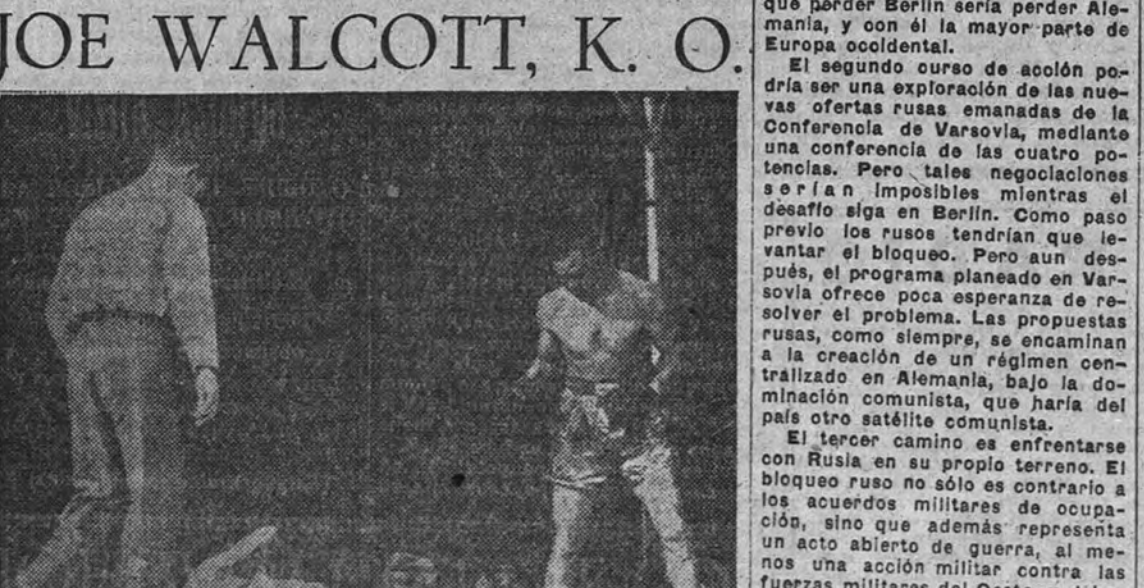
Joe Walcott, K. O. No aquí el momento decisivo en que Joe Louis espera en guardia la reincorporación de Joe Walcott, abatido fulminantemente por el todavía poderoso "K. O." de "la maravilla de Harlem".

colocación de la primera piedra para el monumento al mundo hispano se había celebrado en el altar de los Mártires del Santuario Nacional de la Gran Promesa la entrega del álbum con la lista de los héroes y mártires periodistas caídos en la Cruzada española. Fue un acto sencillo y solemne, donde la emoción no podía ocultarse por el corazón y el pensamiento discurren al mismo tiempo, seguros de vivir uno de los momentos más supremos. Frente al severo túmulo levantado se hallaban presentes todas las autoridades, y tras ellas los vallisoletanos llenaban el templo. Delante, las repúblicas de la Cruzada española.