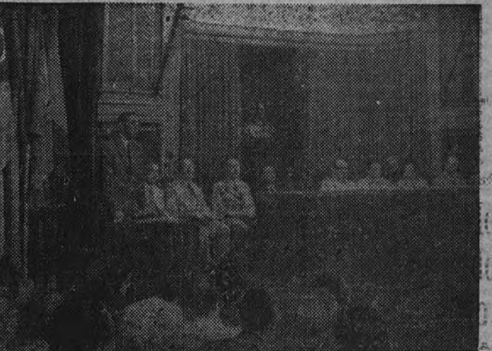
El Ministro de Educación Nacional, acompañado de diversas autoridades españolas y representantes americanos, preside la inauguración del Congreso Hispanoamericano de Cinematografía en el salón de actos del Ateneo de Madrid.

Los congresistas visitaron por la tarde, en El Escorial, el Campamento "Santa María del Buen Aire"