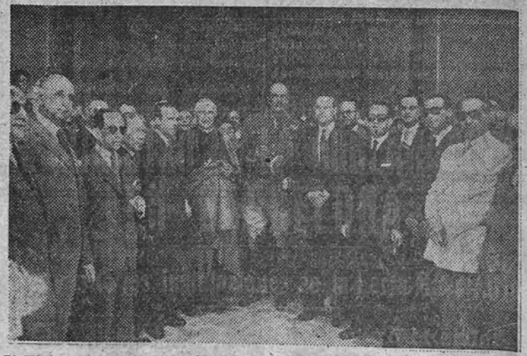
El Ministro de la Gobernación, don Blas Pérez González, acompañado de diversas autoridades, en la inauguración del mercado de abastos de Valencia.

En Valencia y Castellón inauguró el señor Pérez González diversas e importantes obras