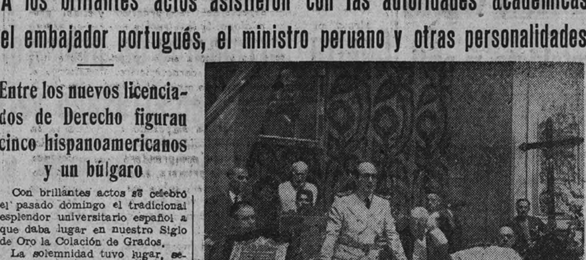
El Ministro de Educación Nacional, a quien acompañan el rector de la Universidad Central y el embajador de Portugal en España, pronunciando su discurso en el acto celebrado en el paraninfo de la Universidad, con motivo de la colación de grado de los nuevos doctores en Derecho.

A los brillantes actos asistieron con las autoridades académicas el embajador portugués, el ministro peruano y otras personalidades