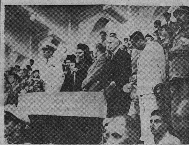
El conde Bernadotte, el obispo de Rodas y el gobernador Mavis, presentando un encuentro atlético en el estadio de Rodas. El obispo colabora con el mediador para el éxito de sus gestiones de paz entre los árabes y judíos de Tierra Santa.

Expedientes de indulto y de libertad condicional. HACIENDA. —Expedientes de crédito y trámite. DECRETOS DE PERSONAL. —Expedientes de trámite e informe sobre asuntos del Departamento. AGRICULTURA. —Expedientes de trámite. EDUCACION NACIONAL. —Informe sobre diversos asuntos del Departamento. OBRAS PUBLICAS. —Decretos. (Continúa en cuarta página)