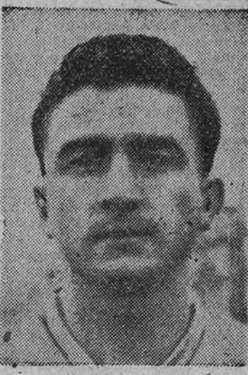
Muñoz, notable jugador del Celta, es muy probable que esta tarde reaparezca frente al Sevilla