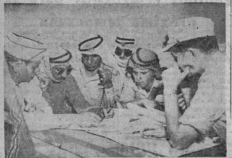
Representantes de árabes y judíos estudian, bajo la supervisión de los miembros de la Comisión de la O. N. U. en Palestina, la línea de demarcación que ha de ser tierra de nadie, con objeto de poder recoger las cosechas abandonadas en la zona de Latrun, donde recientemente se registraron sangrientos combates.