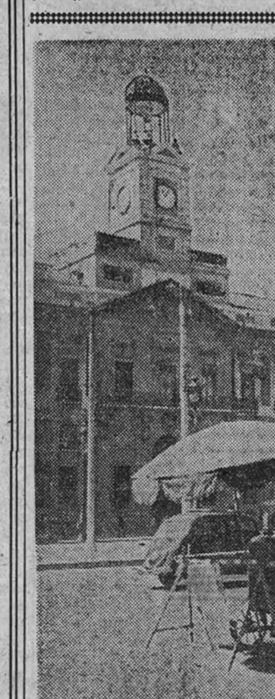
El sol sale para todos; pero para algunos, más. Es justo, pues, que en estos días en que el calor es más severo, se proteja a quienes han de ejercer su trabajo en la vía pública. Esta sombrilla que resguarda del sol a los servidores de la máquina compresora, pone además en la primera plaza madrileña una nota colorista que casi nos hace creer que la providencial mano del Ayuntamiento ha instalado en plaza calzada un puesto de refrescos para los sudorosos peatones.