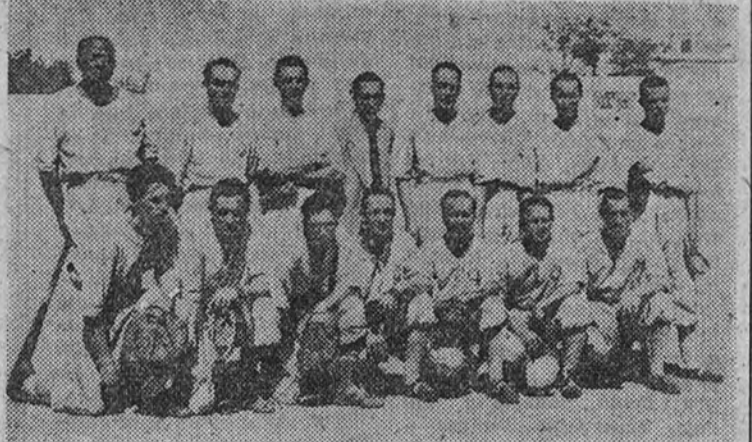
El Español, actual campeón de Cataluña, juega esta tarde con el Atlético de Madrid, subcampeón castellano

Esta tarde, en el campo de Chamartín, se jugarán las primeras semifinales del Campeonato de España de pelota base. El Barcelona jugará con el Madrid y el Español con el Atlético.