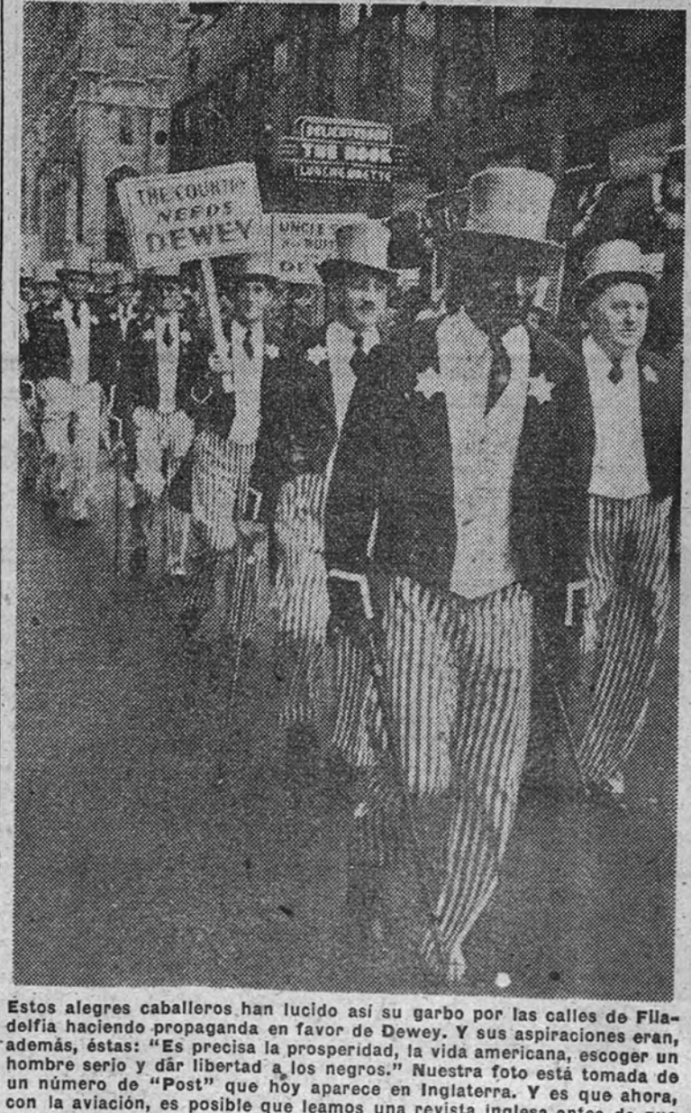
Estos alegres caballeros han lucido así su garbo por las calles de Filadelfia haciendo propaganda en favor de Dewey. Y sus aspiraciones eran, además, éstas: "Es precisa la prosperidad, la vida americana, escoger un hombre serio y dar libertad a los negros." Nuestra foto está tomada de un número de "Post" que hoy aparece en Inglaterra. Y es que ahora, con la aviación, es posible que leamos una revista inglesa antes de que se haya puesto a la venta en las calles de Londres