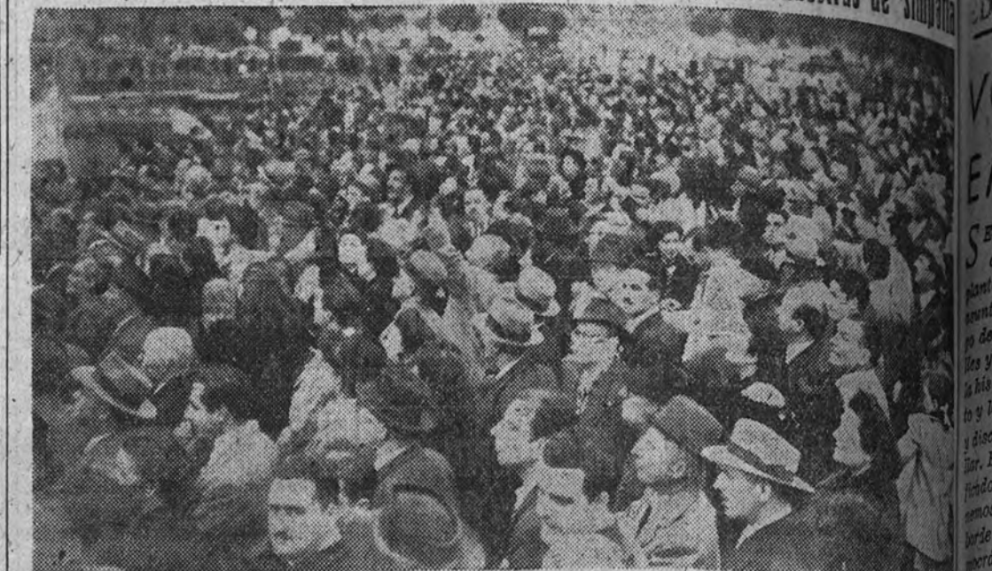
Los Grupos de Danzas de la Sección Femenina son despedidos en los muelles de Buenos Aires por multitudes de personas; un grupo de las cuales, en la emoción del momento, rompe los cordones de marineritos para mantener un poco alejado a la gran cantidad de público que acudió, a despedirlas.

En los lugares donde han actuado, los Grupos recibieron las mayores muestras de simpatía