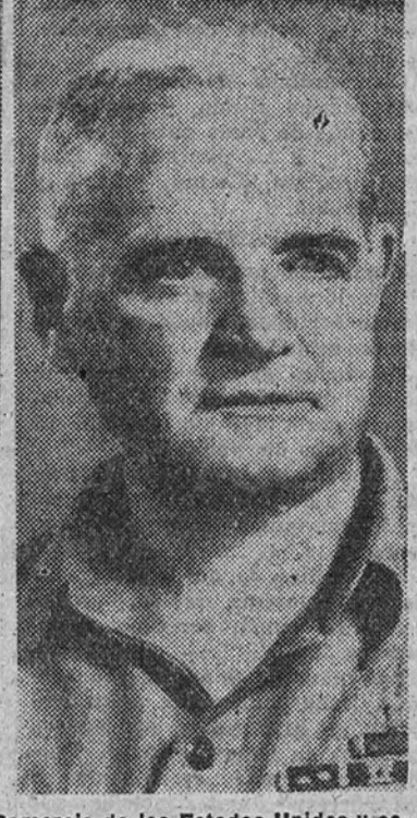
Averell Harriman, ex secretario de Comercio de los Estados Unidos y colaborador directo de Marshall, cuyas conferencias secretas con los altos jefes del Ejército eran publicadas íntegramente por la Prensa comunista francesa a los tres días de celebrarse. El general Donovan, jefe de la sección de Servicios Estratégicos del Ejército americano y descubridor de uno de los primeros "affaires" de espionaje militar en favor de la U. R. S. S.

Para el ciudadano medio norteamericano, las historias de espionaje, de complot políticos o de conjuras revolucionarias, no fueron hasta ahora otra cosa más que temas de novela policíaca o de películas de aventuras. El yanqui fuera granjero en Texas o senador en Washington—estaba habituado a ver al clásico espía bajo la fisonomía extraña de Edward Robinson y tenía el absoluto convencimiento de que todo asunto de espionaje ha de terminar infaliblemente de la misma manera: el siniestro individuo acaba sus días en la silla eléctrica, mientras el heroico detective que le descubrió se casa con la rubia protagonista. Marcha nupcial, preta metros de beso y "happy end". Han sido precisos algunos años para que este yanqui ingenuo, aficionado a los films de gran acción y a las novelas detectivescas, se convenciera de que desde la creación de cierto organismo llamado Komintern de Moscú, el espionaje, el complot revolucionario, el terrorismo, la conspiración política han bajado de la pantalla para mezclarse, fatal y decididamente, en su vida propia y diaria, en su "business" cotidiano. Al principio, el yanqui no se dio cuenta del hecho. Cuando, allá en 1925, se organizó una colosal campaña de Prensa—magníficamente orquestada por Moscú—para defender a dos asesinos condenados a muerte por el Tribunal de Boston, el 99 por 100 de los ciudadanos de los Estados Unidos se quedó realmente perplejo y asom-