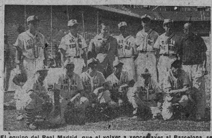
El equipo del Real Madrid, que al volver a vencer ayer al Barcelona, se ha proclamado finalista del Campeonato de España

El Atlético y el Español, empatados a una victoria, jugarán hoy el partido decisivo