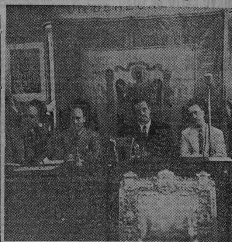
El Ministro de Trabajo con el director general de Trabajo, Delegado Nacional de Sindicatos y otras personalidades, durante el acto de homenaje tributado ayer al segundo por la Organización Sindical madrileña (Foto Contreras).

El Delegado Nacional clausuró el acto, marcando las consignas que los Secretarios deben tener presente en su labor. Este cursillo