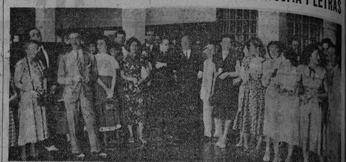
El decano de la Facultad de Filosofía y Letras y el director del Instituto de Cultura Hispánica, con los universitarios norteamericanos, después del acto de ayer celebrado en la Ciudad Universitaria.

En medio de una plazuela y rodeada de frondosa arboleda, entre un ambiente agradable y acogedor, se inauguró oficialmente el curso para los estudiantes norteamericanos en la Facultad de Filosofía y Letras.