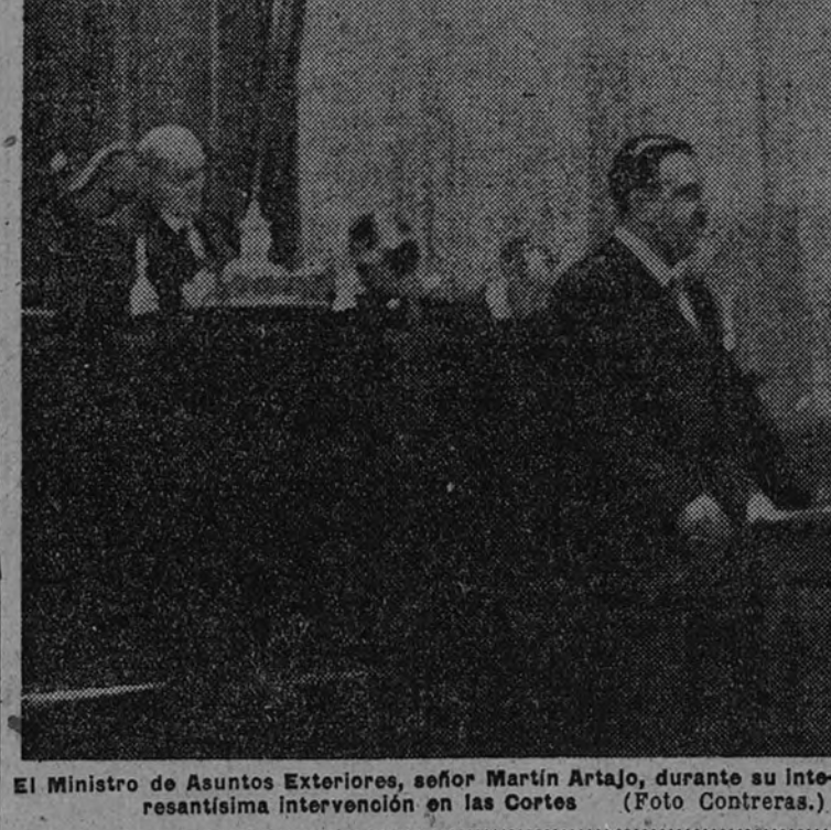
El Ministro de Asuntos Exteriores, señor Martín Artajo, durante su interminable intervención en las Cortes.

La Argentina y Portugal fueron objeto del homenaje de la Cámara durante el discurso del Ministro de Asuntos Exteriores