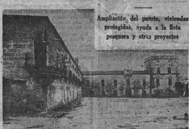
Ampliación del puerto, viviendas protegidas, ayuda a la flota pesquera y otros proyectos

CAMBADOS 24. — Para fecha inmediata se esperan en este pueblo importantes obras que contribuyan a sostener y mejorar su economía, principalmente pesquera.