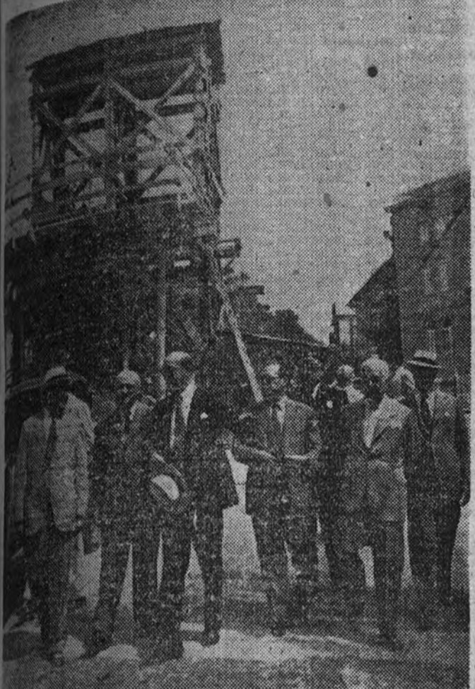
Alcalde de Barcelona y demás autoridades, durante su visita con la Corporación Municipal al túnel de la calle de Balmes