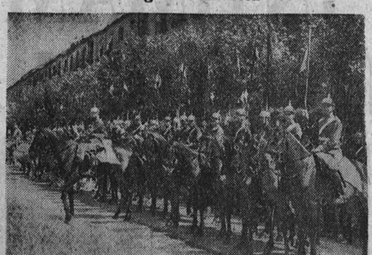
Un escuadrón del Arma rindió honores en la iglesia del Buen Suceso, donde se celebró la fiesta religiosa en honor del Santo Patrono