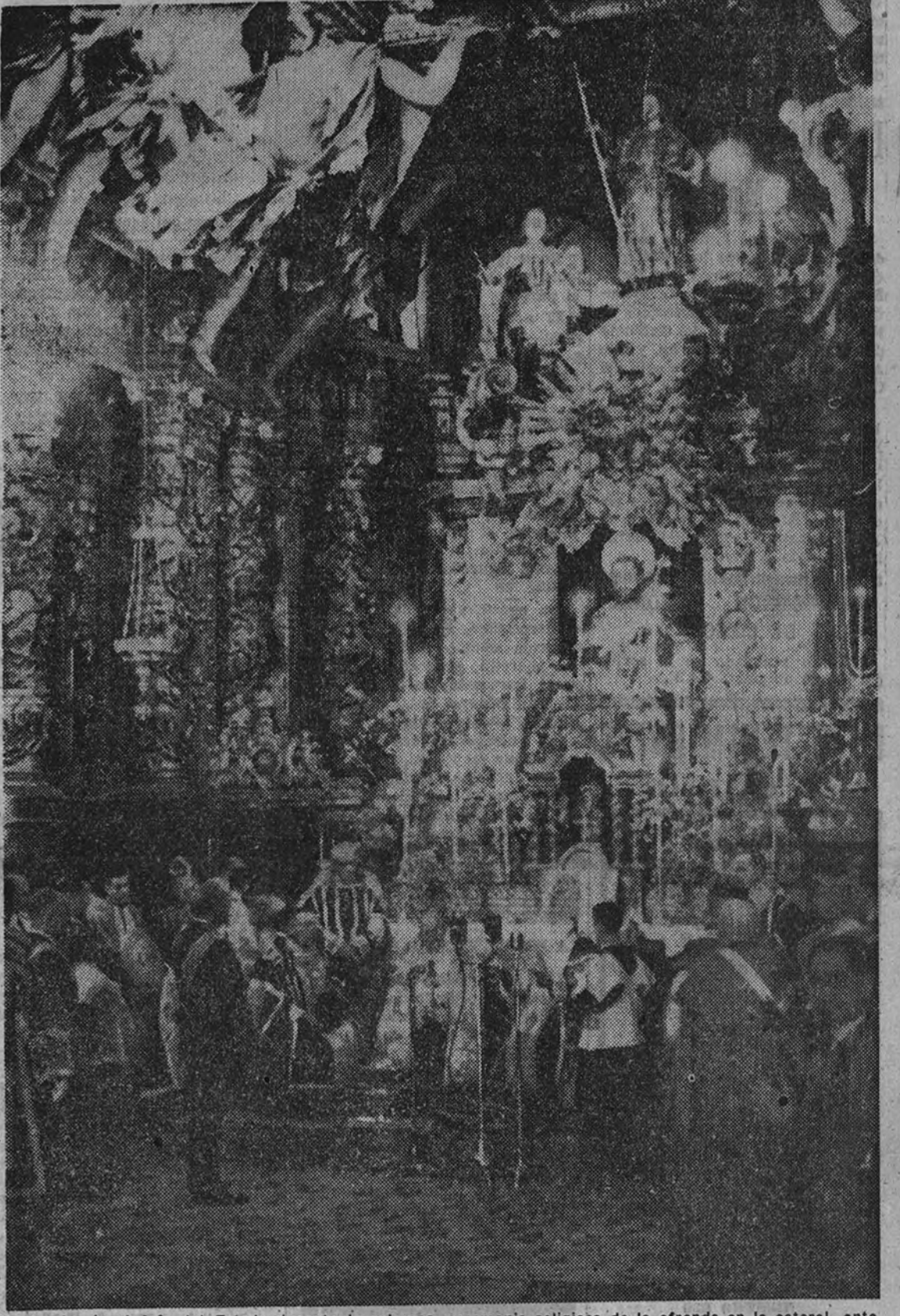
Su Excelencia el Jefe del Estado durante la solemne ceremonia religiosa de la ofrenda en la catedral, ante la imagen de Santiago Apóstol

SAN SEBASTIAN 26.—El barón de las Torres, primer introductor de embajadores, ha cumplimentado a mediodía a las autoridades provinciales y locales con motivo del comienzo de los servicios del Ministerio de Jornada, que funcionará durante la temporada veraniega. Mañana por la tarde llegará el Ministro de Asuntos Exteriores, don Alberto Martí Martínez, que en calidad de Ministro de Jornada continuará en esta capital las tareas de su cargo. (Cifra.)