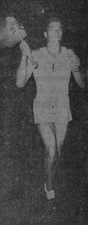
En una espectacular prueba de relevos en la que han intervenido atletas de diversos países, la antorcha olímpica, que hace varios días salió de Grecia, conducida anoche a través del Canal a bordo del destructor británico "Bluestar" y recibida con gran entusiasmo en tierra inglesa, llegará esta tarde al estadio de Wembley, donde servirá para prender fuego a la llama olímpica que ha de estar encendida durante el desarrollo de esta magna competición.