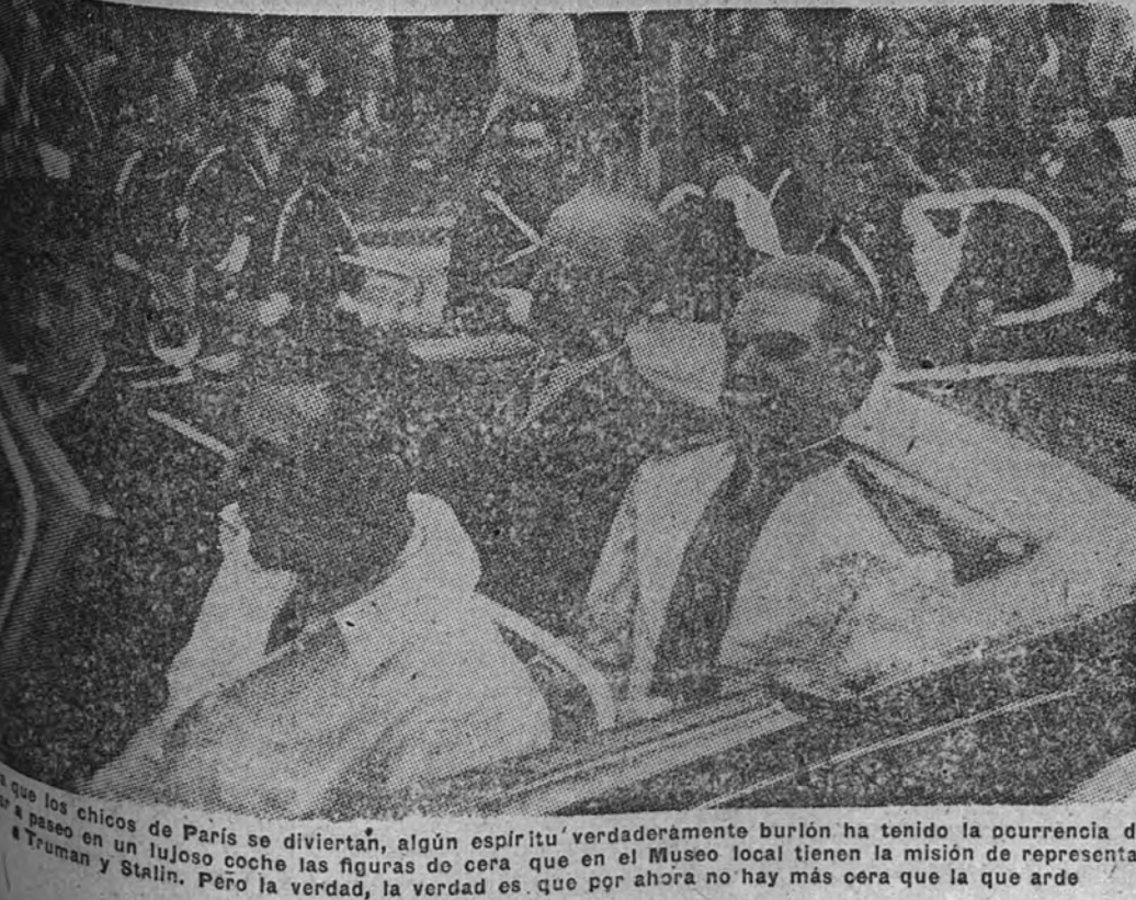
Los chicos de París se divierten, algún espíritu verdaderamente burlesco ha tenido la ocurrencia de pasear en un lujoso coche las figuras de cera que en el Museo local tienen la misión de representar a Truman y Stalin. Pero la verdad, la verdad es que por ahora no hay más cera que la que arde.