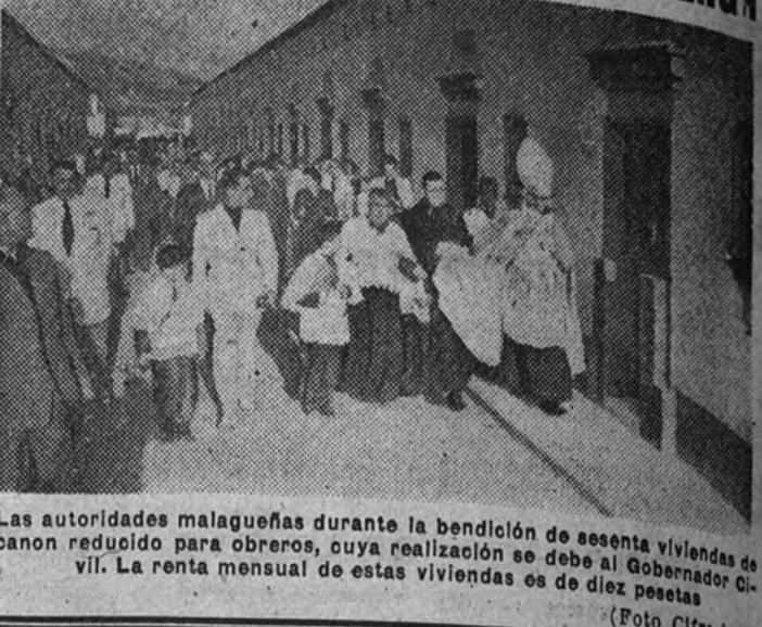
Las autoridades malagueñas durante la bendición de sesenta viviendas de canon reducido para obreros, cuya realización se debe al gobernador civil. La renta mensual de estas viviendas es de diez pesetas.