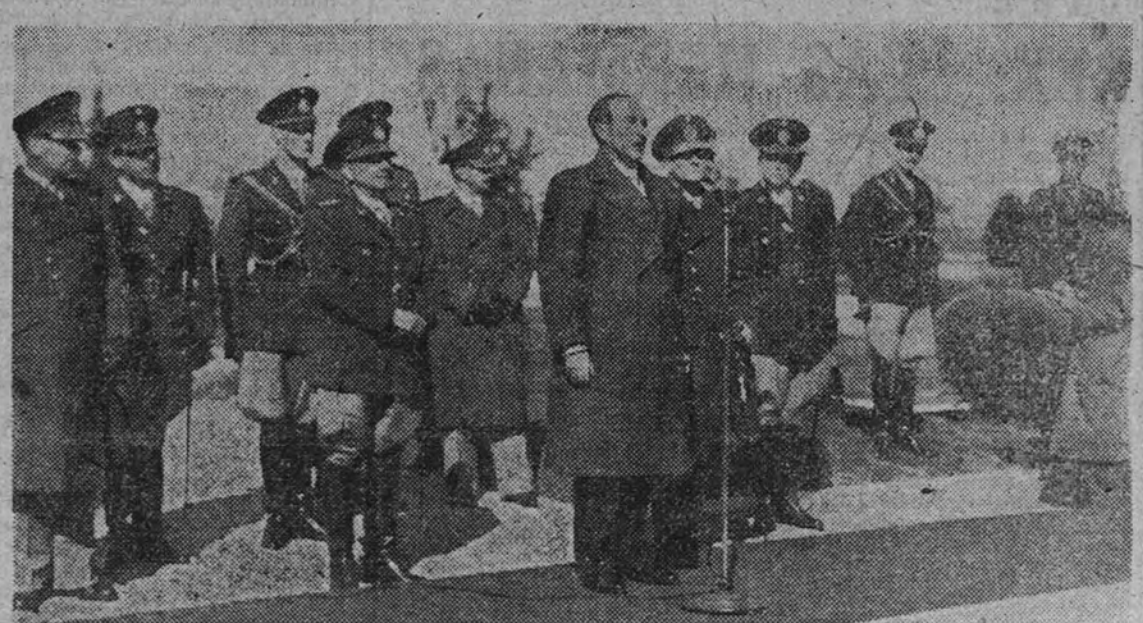
Nuestro embajador en Buenos Aires, don José María de Arellano, pronunciando un discurso en el acto de entrega de una maqueta del glorioso Alcazar de Toledo, que ha sido regalada por los cadetes españoles a la Academia de Infantería de la Argentina. En la ceremonia se puso de manifiesto, una vez más, la hermandad de ambas naciones y el compañerismo reinante entre los dos Ejércitos.