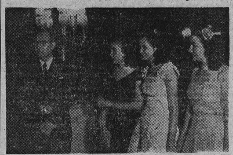
La señorita Quirino durante la recepción de despedida que ofreció ayer en Madrid