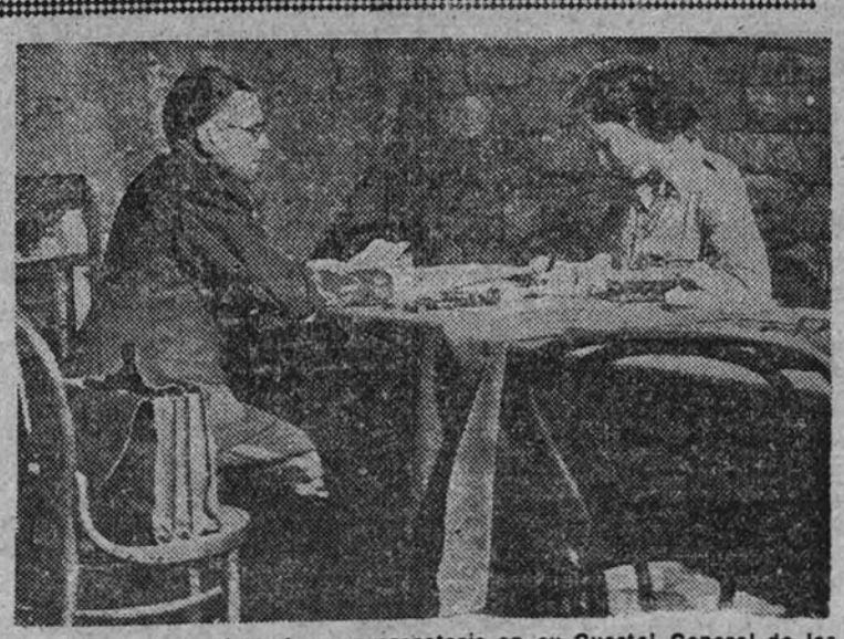
El mariscal Tito dictando a su secretaria en su Cuartel General de las montañas de Bosnia

En Ginebra se ha celebrado un Salón del Automóvil, y la casa Opel ha presentado su modelo "Olimpia", 15 caballos, puesto a disposición de quien quiera gastarse 455 libras esterlinas, o bien 393.000 francos, el precio más barato del mundo para un vehículo de esa potencia. El que Opel prevea un plan de fabricación de 50.000 coches en el ejercicio actual es algo que quita el sueño a los europeos de Francia y las Islas Británicas, que están absolutamente seguros de que el mercado de los Países Bajos, Bélgica y Suiza será inmediatamente controlado por el nuevo trust. Por otra parte, el coche popular alemán, típica creación nacionalsocialista, está a punto de ser puesto en marcha, con sus cuatro caballos al alcance de todas las fortunas. La concurrencia italo-americana y germanoamericana amenaza con hundir la producción francesa y británica. Un periódico alemán acaba su información con esta angustiosa pregunta: "¿Deberán cerrar las fábricas de los arrabales parisenses?"