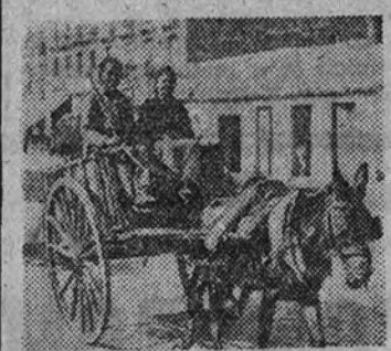
En el patio del Ayuntamiento

fué presentado el nuevo tipo de camión de basuras que se va a emplear para los servicios de la ciudad. Es un modelo de la Casa Ochano, de Zurich, y el procedimiento es de carga por parte trasera con prensa hidráulica, siendo la carrocería de metal ligero. En muchas capitales como Londres, Roma, Palermo y otras del centro de Europa se usa ya este modelo, que en breve comenzará a funcionar en nuestra ciudad.