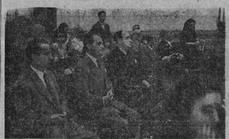
Presidencia del funeral