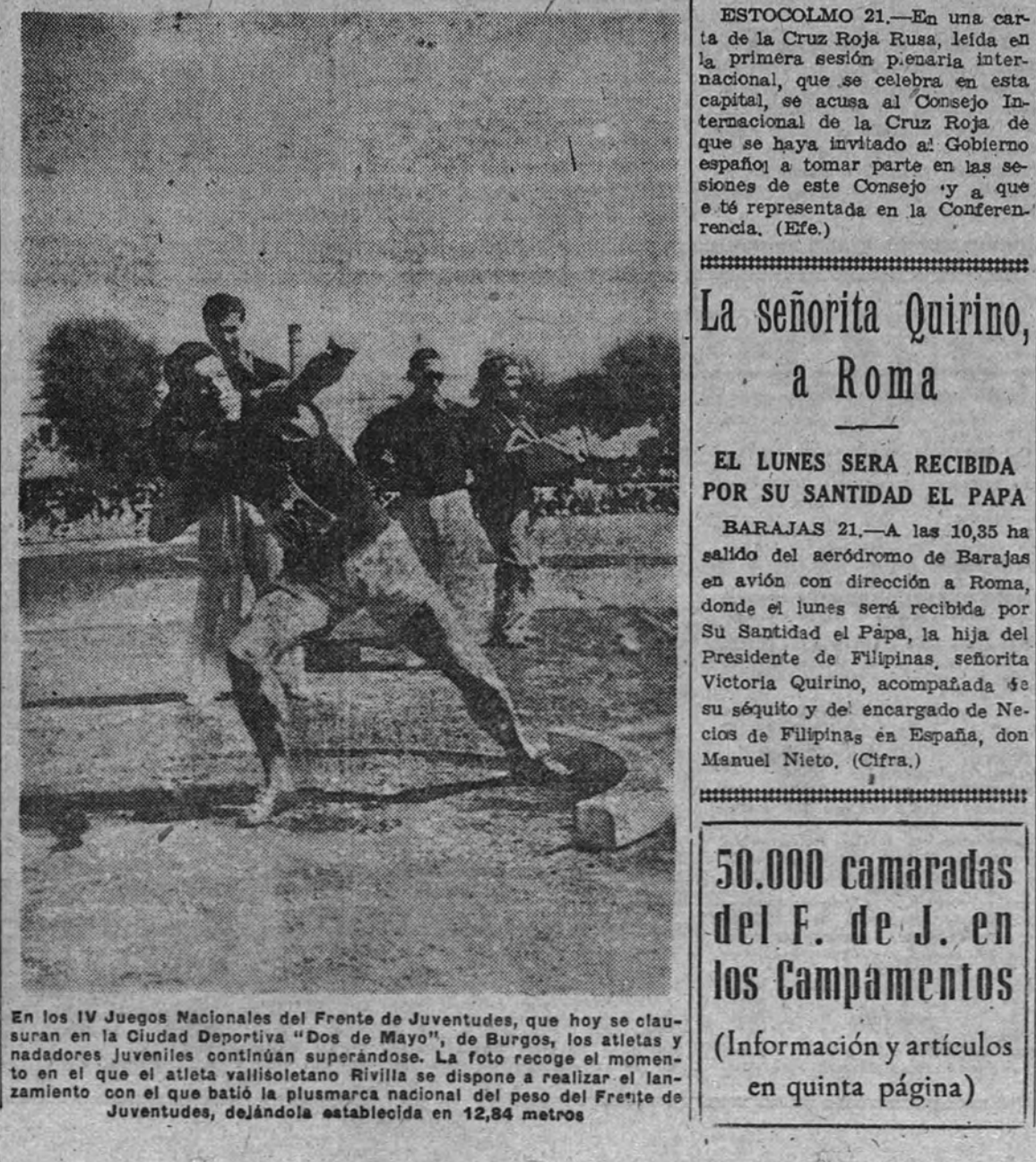
En los IV Juegos Nacionales del Frente de Juventudes, que hoy se clausuran en la Ciudad Deportiva “Dos de Mayo”, de Burgos, los atletas y nadadores juveniles continúan superándose...