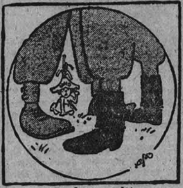
(Desde el suelo) LA O. N. U.—Si ustedes no se avienen inmediatamente, me voy obligando a meterlos en cintura...