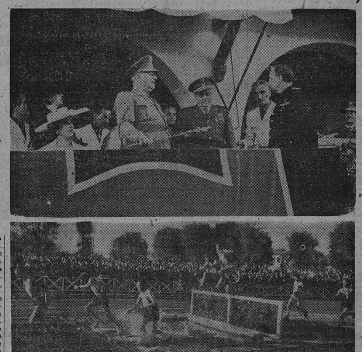
En la Olimpiada juvenil de la Falange lo menos importante, con haberlo sido mucho, son las marcas conseguidas. Resalta en esta pacífica movilización de la juventud española el poder cohesivo de la Falange en torno al Caudillo que, aún reciente la aleccionadora celebración de la Olimpiada de Londres, ha ofrecido a España la fórmula de su resurgimiento deportivo