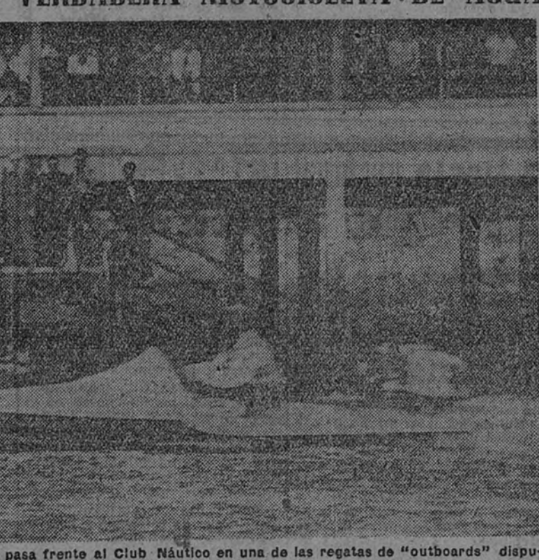
El vencedor de una de las series, pasa frente al Club Náutico en una de las regatas de "outboards" disputadas en Santander.

EL "OUT-BOARD", VERDADERA MOTOCICLETA DE AGUA