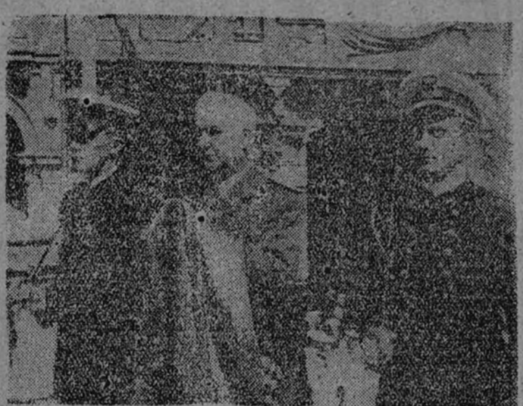
El Ministerio de Obras Públicas porta la espada de San Fernando en la solemne procesión cívico-religiosa organizada en Avilés para conmemorar el VII centenario de la Marina de Castilla