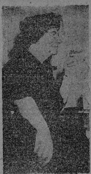
Madame Gold Mayerson, ilustre señora judía, ha sido nombrada embajadora del joven Estado de Israel en Moscú