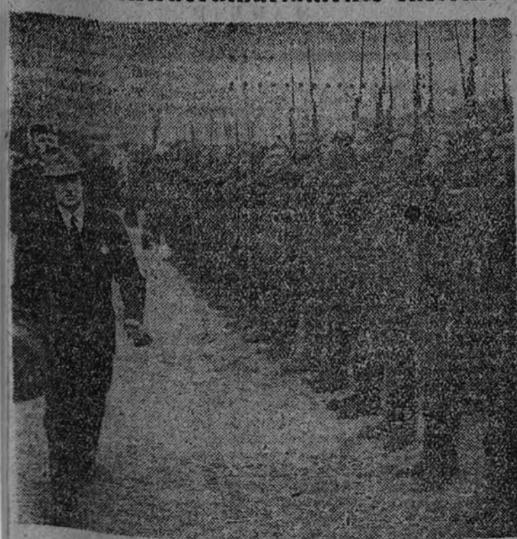
Benes visita las tropas de Stalin

PRAGA 31.—Un boletín médico publicado esta noche dice que el estado del ex Presidente Benes es "extraordinariamente grave". Benes sufre de arterioesclerosis, y a las cinco de la mañana de hoy perdió el conocimiento. Por la tarde el pulso era irregular, mientras la presión de la sangre va declinando. (Efe.)