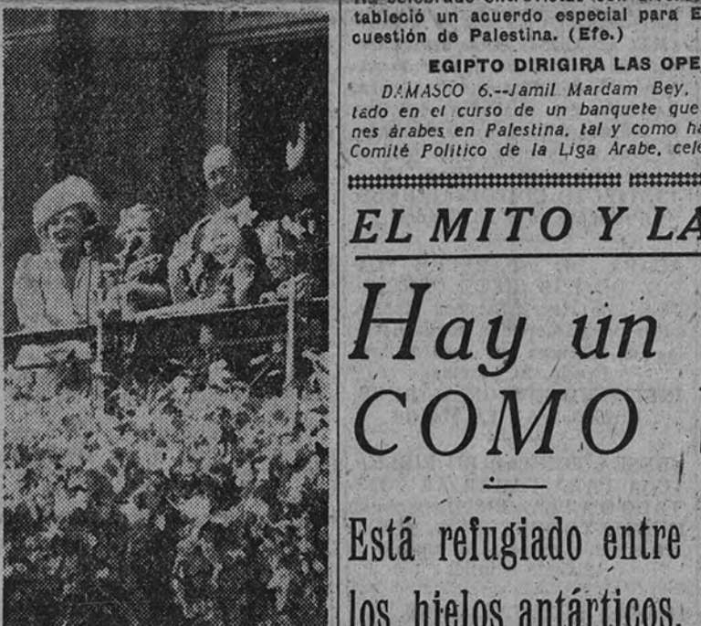
Como corresponde en un país de gladiolos y tulipanes, la nueva Reina de Holanda, con su esposo y tres de sus cuatro hijos, recibe el homenaje de su pueblo desde un florido balcón del palacio de Dam.

momentos después de la ceremonia de la coronación