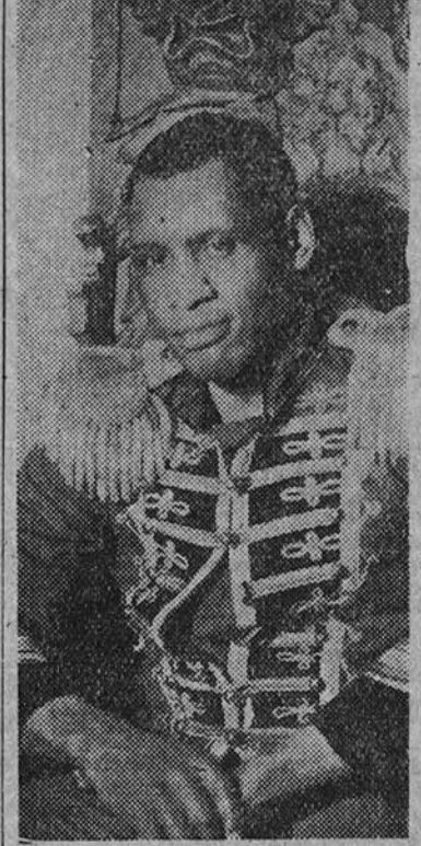
Robeson, vestido de mariscal soviético