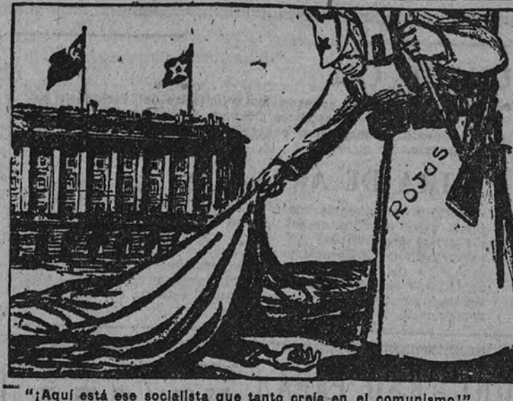
"¡Aquí está ese socialista que tanto creía en el comunismo!" (De "Brancalione", Roma.)

POCAS divagaciones y consideraciones políticas exige el tema de la crisis francesa y de su desenlace. Aparentemente, el Gobierno que acaba de enfrentarse con el angustioso panorama económico y social de Francia difiere muy poco del anterior. Es decir, se trata de un conglomerado más de aquella "Troisième Force" que el anciano León Blum ideó, como sinapismo político, para centrar a la República en una cierta estabilidad y sosiego. Y, sin embargo, la realidad es que este Gobierno, tan parecido en sus ingredientes parlamentarios al de André Marie, representa el fracaso más estrepitoso y definitivo de la "Tercera Fuerza". No importa que democristianos y socialistas prolonguen en él su inevitable coyuntura política, y que los equipos parlamentarios propios y ajenos, ante el temor de una disolución de la Asamblea, garanticen disciplinadamente sus votos. Es igual, porque dure lo que dure el actual Gobierno, no será su precaria existencia lo que revele el significado de la pasada crisis. Sólo el miedo sin paliativos, un miedo opaco y disforme, ha regido la crisis política desde sus más pequeños antecedentes y a lo largo de toda su penosa tramitación.