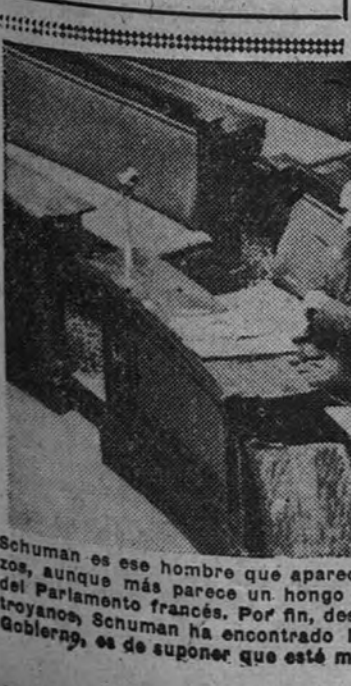
Schuman es ese hombre que aparece solo, pensativo y cruzado de brazos, aunque más parece un hongo que acaba de nacer en el hemisferio de los trópicos. Por fin, después de varios días de ir de tirón a trocianos, ha encontrado la margarita propicia. Como ya tiene Gobierno, se le supone que está menos aburrido y algo más fotogénico.

UNA PRIMA DE 2.500 FRANCOS PARIS 5.—El Gabinete Schuman ha acordado conceder a todos los (Continúa en cuarta página.)