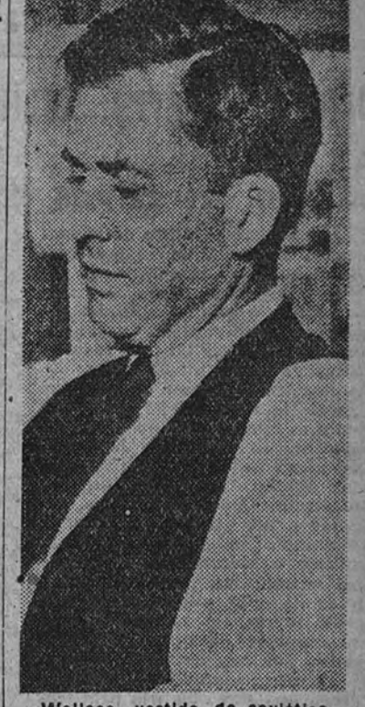
Wallace, vestido de soviético

han abandonado en los Balcanes al general Mihailovich, al monarca albanés, para a p o r, en cambio, a Tito, agente de Moscú?