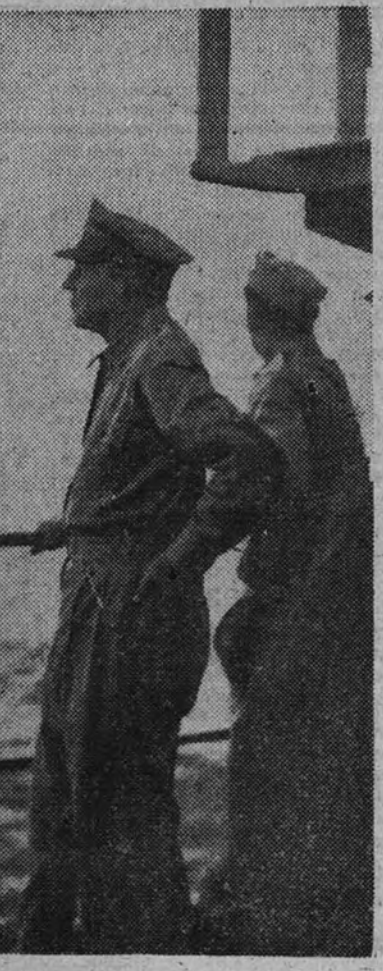
(Continúa en cuarta página)