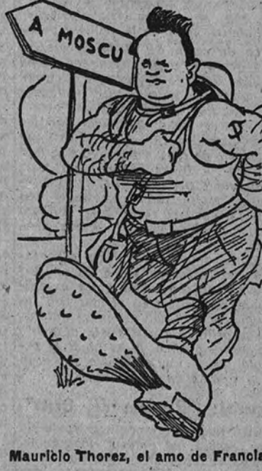
Maurilio Thorez, el amo de Francia

SE CONSIDERA COMO ÚNICA SOLUCIÓN UN GABINETE DE UNIÓN NACIONAL PARIS 7. —Los observadores políticos consideran que la única solución a la actual crisis política es la formación de un Gobierno de unión nacional, en el que participen todos los grupos de la Cámara, desde la extrema derecha a los socialistas, excluyendo solamente a los comunistas. Se sugiere que tal Gobierno podría ser presidido por un socialista como Jules Moch, actual ministro del Interior, o posiblemente, aunque no probablemente, por René Pleven, que fue ministro de Hacienda con el general De Gaulle, y cuyo nombre se menciona en el debate de hoy se estima restó muchos votos en la votación de confianza.