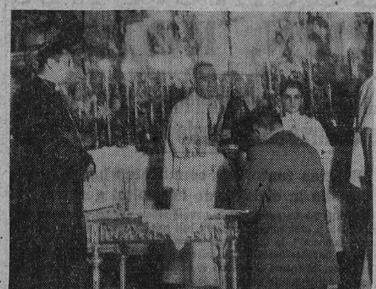
El obispo auxiliar de Río de Janeiro entregando la imagen de la Inmaculada Aparecida, Patrona de Brasil, a las Juventudes de Acción Católica Española.

Se verificó por el obispo auxiliar de Río y los peregrinos brasileños