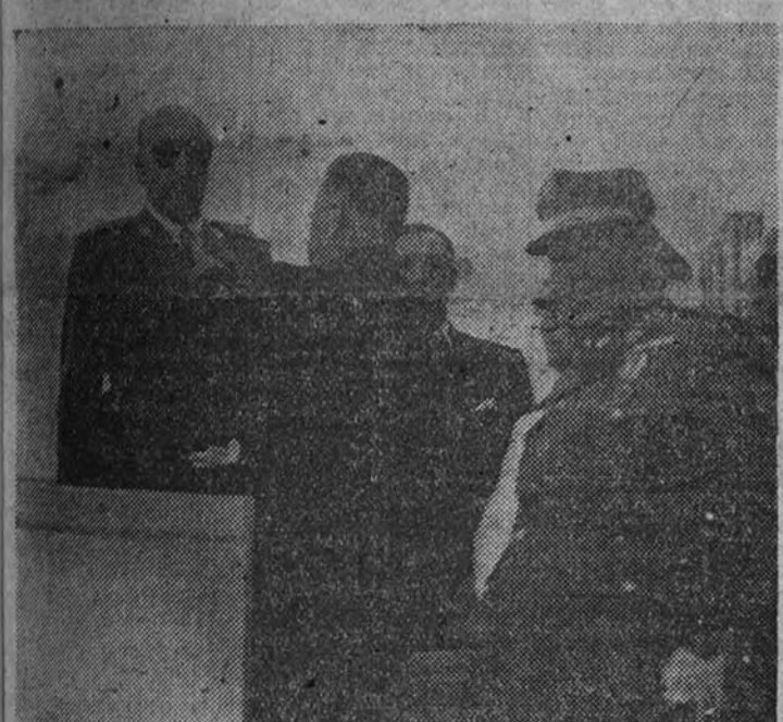
El Alcalde de la ciudad impone la Medalla de Oro de Tarifa al conde del Alcazar de Toledo, cuya heroica gesta se compara a la realizada por Guzmán el Bueno en la defensa de aquella plaza