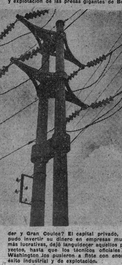
der y Gran Coulee? El capital privado, que pudo invertir su dinero en empresas mucho más lucrativas, dejó languidecer aquellos proyectos, hasta que los técnicos oficiales de Washington los pusieron a flote con enorme éxito industrial y de explotación.

La técnica española, en cuanto respecta al planteamiento y a la construcción de estas centrales, ha sabido resolver problemas de extraordinaria envergadura. La interconexión de estas centrales térmicas con la gran red hidroeléctrica nacional representa—como el señor Suanzes dijo a nuestro periódico en sus recientes declaraciones—un paso decisivo en la electrificación española. Ni el capital ni la iniciativa privada tuvieron gran interés en acometer el problema, y en cierto modo—como también señala el Ministerio—es lo que esta poderosa palanca la red térmica nacional quede manos cercanas a los Poderes públicos, sin conceder determinación y peligrosas primicias en detrimento del interés común de todos los españoles. Nos limitamos a señalar, por lo tanto, este esencial tema planteado por el nistro de Industria y Comercio, por creencia de falangistas, que representa una excepción en la gran revolución industrial y económica de España.