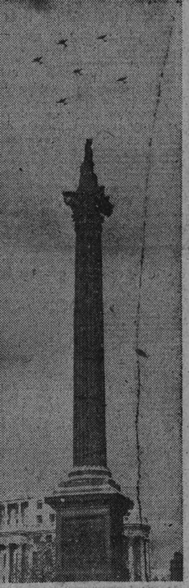
La R. A. F. ha conmemorado solemnemente el aniversario de la histórica batalla de Inglaterra. Hoy algunas formaciones de la aviación militar al volar sobre la columna de Nelson, en la plaza de Trafalgar de la capital inglesa.