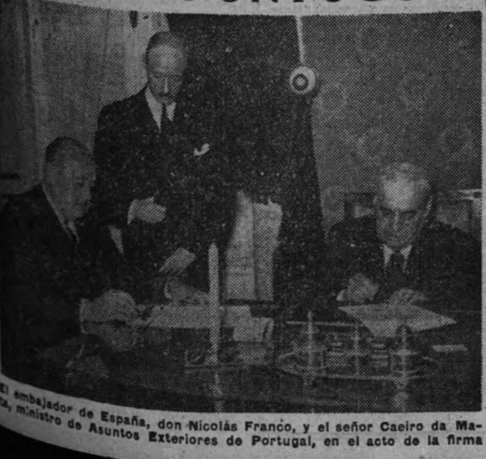
El embajador de España, don Nicolás Franco, y el señor Casero da Mota, ministro de Asuntos Exteriores de Portugal, en el acto de la firma.