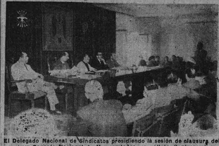
El Delegado Nacional de Sindicatos presidiendo la sesión de clausura del Consejo Nacional de Hermandades.

Ayer mañana, en el salón de actos de la Delegación Nacional de Sindicatos, se ha verificado la clausura del Consejo Nacional de Hermandades, que comenzó sus sesiones el día 20 del actual.