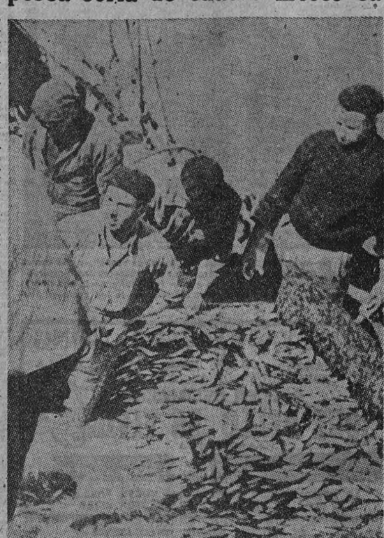
La pesca de la sardina en el litoral gallego

Algunas veces, y sobre todo cuando los hombres de las ciudades de tierra adentro tenemos ocasión de bajar al mar para curarnos un poco la retina, no se puede pensar en la poca importancia que concedemos a ese beneficio inmenso que en progresión creciente nos entregan los mares todos los años, sin el temeroso cuidado de que las plagas ni las sequías o la falta de abonos sean causa de una cosecha ruinosa. En España, país eminentemente pesquero, esta ha sido una hermosa realidad en todos los tiempos, y en los momentos más difíciles ha sido el mar un venero que ha salvado el hambre a la Nación. Ahora mismo son las gentes del mar las únicas que pueden ofrecer en condiciones sus artículos a precios inferiores a los de las tasas oficiales. Es ésta la gran despesa de España, y por eso nos atrae y nos preocupa.