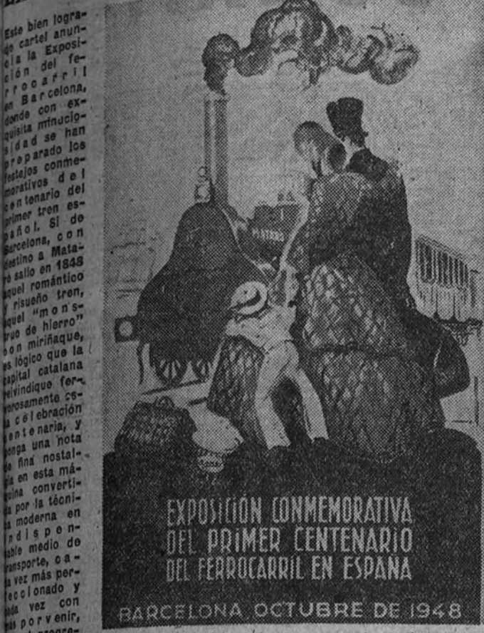
EXPOSICION CONMEMORATIVA DEL PRIMER CENTENARIO DEL FERROCARRIL EN ESPAÑA. BARCELONA, OCTUBRE DE 1948

Esta bien lograda exposición conmemorativa del primer centenario del ferrocarril en España, que se inauguró en Barcelona el 15 de octubre, con el título de "Exposición del Ferrocarril", es una muestra de la importancia que el ferrocarril ha tenido en la historia de España. Los actos que con este motivo se van a celebrar en la ciudad condal, revestirán el mayor esplendor y brillantez.